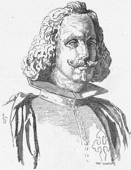
DON FRANCISCO DE QUEVEDO

d'après la terre cuite conservée dans la Bibliothèque nationale de Madrid.