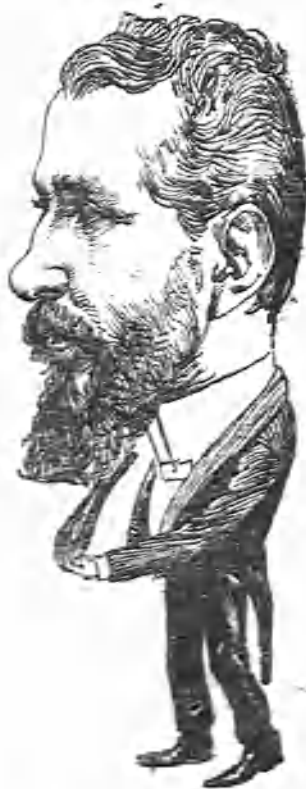
EL MAESTRO MANCINELLI