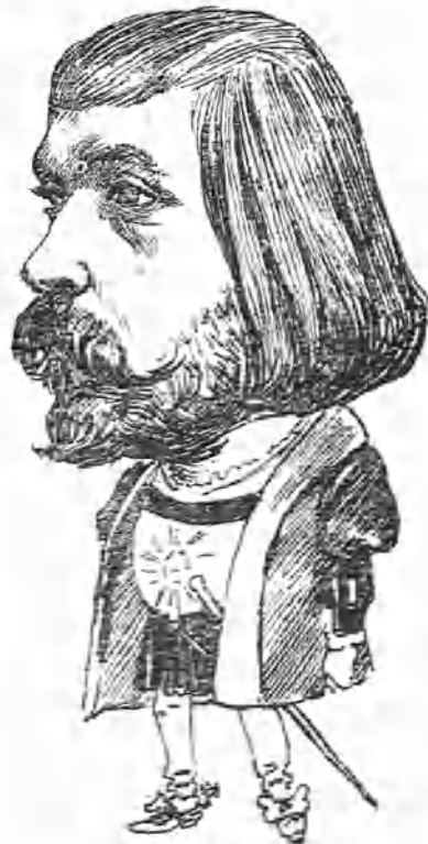
EL TENOR MORETTI