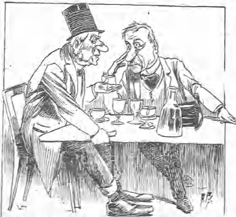
—Voy á dar una conferencia en el Ateneo acerca de los callos y uñas gordas, haciendo experiencias con mis propios pies.