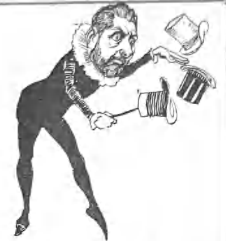
LOS TRES SOMBREROS