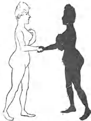
BLANCO Y NEGRO

Gedeón, después de haber visto La bofetada , está decidido á hacerse empresario, porque otro afamado autor, cansado de sus impertinencias, le ha ofrecido darle una bofetada... que ni la de Novo y Colson.