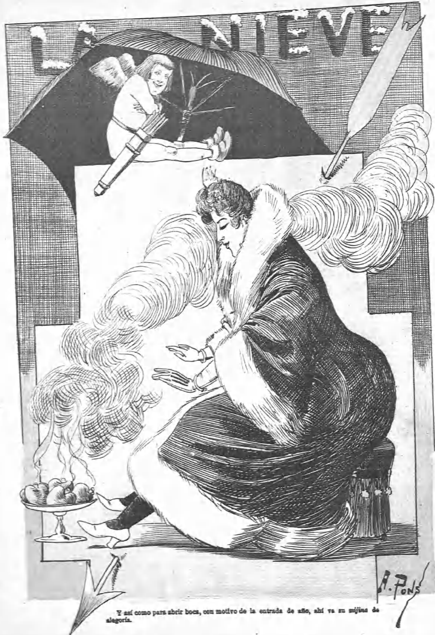
Y así como para abrir boca, con motivo de la entrada de año, ahí va su mijina de alegoría.