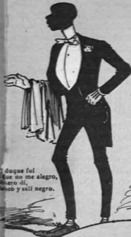
Al baile duque fui Y en vez que no me alegro, Pues tan fino di, Que entristecí y salí negro.