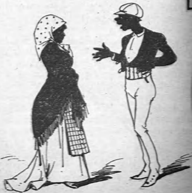
—Vamos chíc que te cayes, Tú le quieres. —Que nó, chico