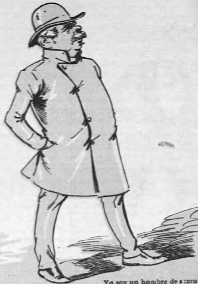
Yo soy un hombre de acero De valor tan bien templado, Que aunque ya me han retirado ¡Guerra, guerra! ¡Paz no quiero!