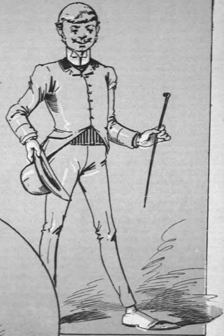
Psch... me di tan malas trazas, Que á pesar de mi figura, En lugar de su hermosura Solo logré... calabazas.