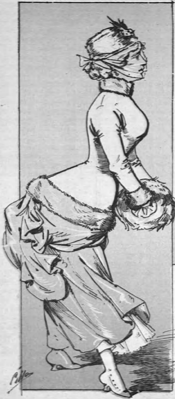
Esta niña va perdida Buscando con gran empeño, Quien le pague una comida, Aunque tenga torvo el ceño.