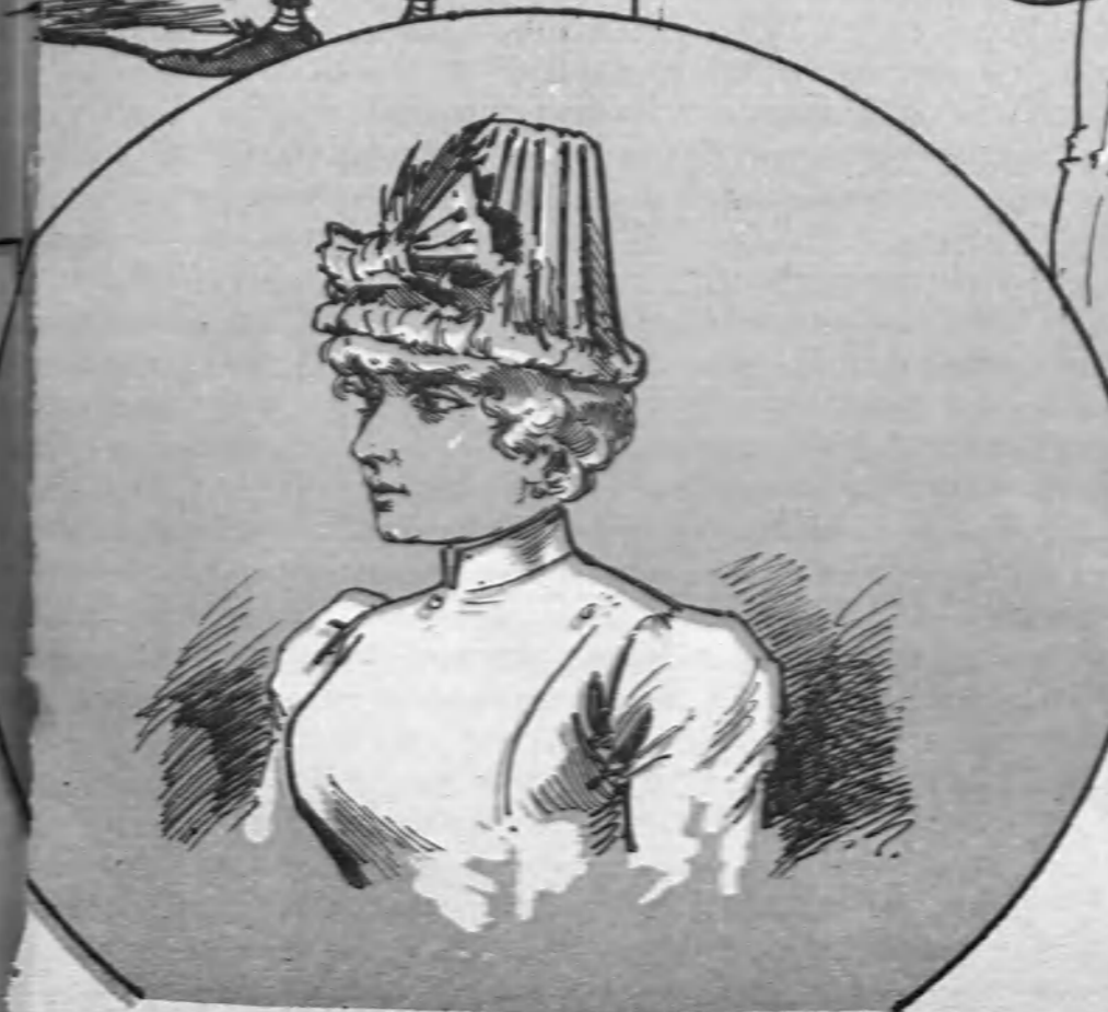
Novia de varios señores, Divina y bien arreglada, Y...