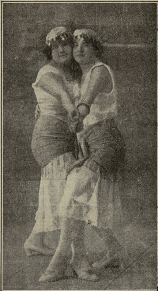
Pilarita y Corinto.

Doña Beatriz sonrió al ver la equivocación de su amiga y queriendo dar á ésta una lección práctica, ordenó al pinche que se llevara el pavo á la cocina y después