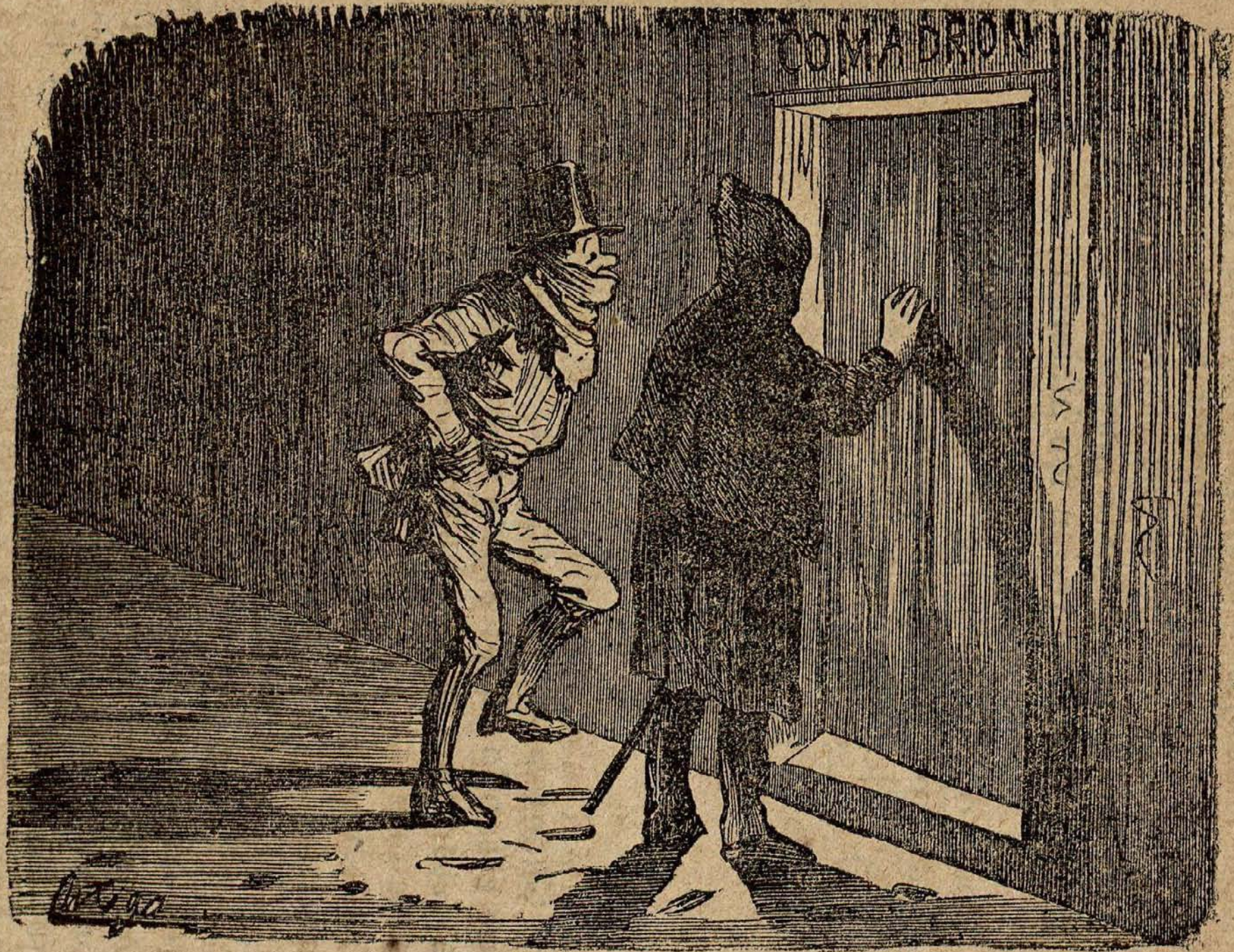
Una de las infinitas plagas del matrimonio.