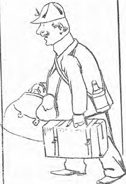
FOR SEGUIR A LA INGRATA.