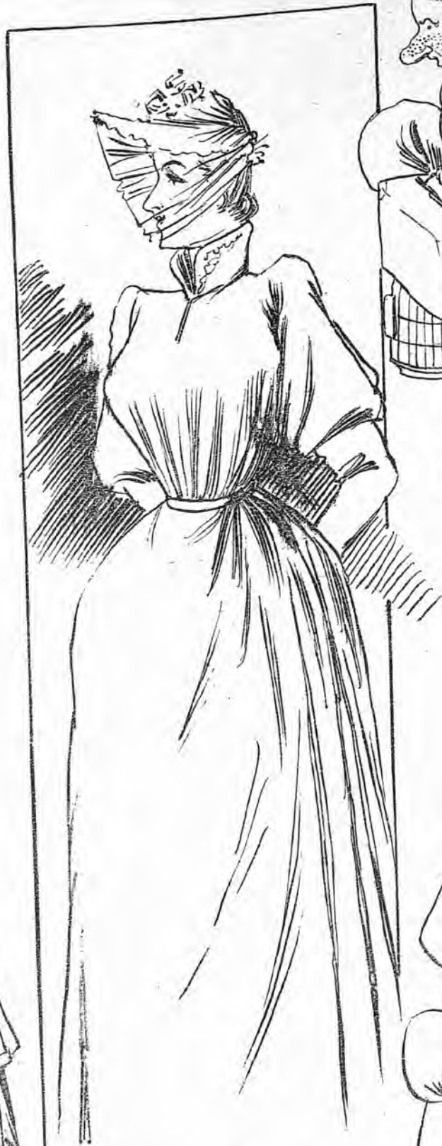
FOR RAZONES ESPECIALES.