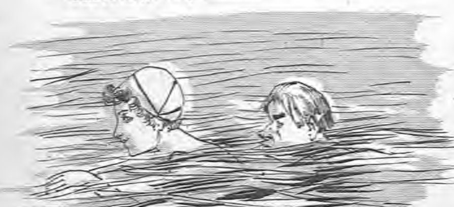
—Hija mía, por Dios, no alee tanto los pies, que ya me ha dado dos golpes en los mismos sitios.