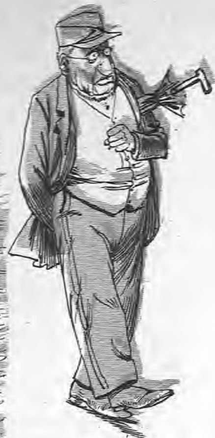
El representante de una fábrica de objetos de nácar que ha ido á ver si le vendían unos pedazos de la célebre Concha.