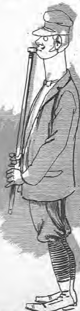
Yo vine á ver la gran semana de Biarritz y me he encontrado con que tiene siete días como todas las semanas de todas partes.