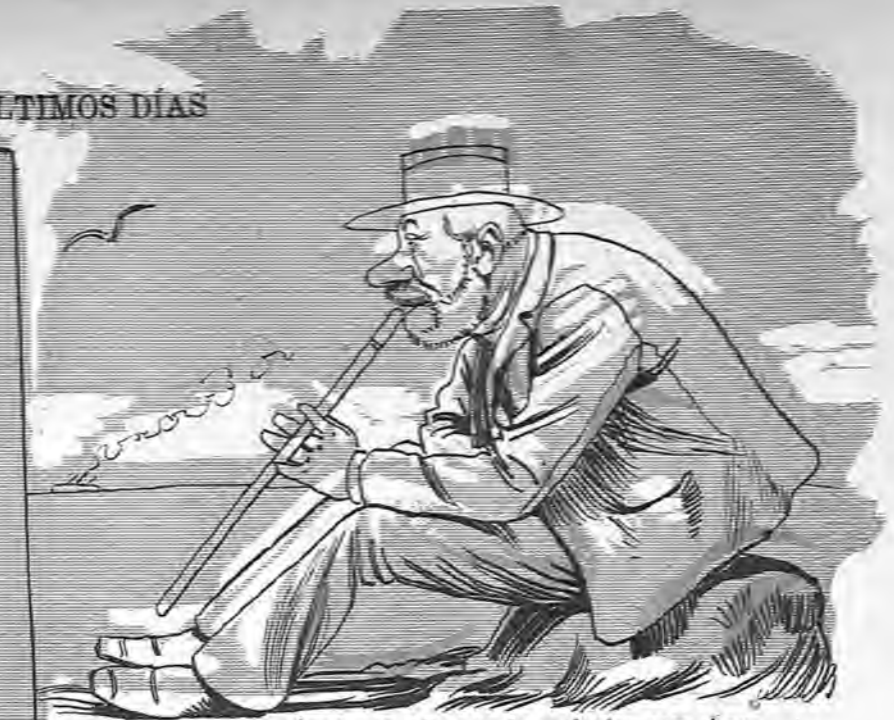
—¿Cómo se ríe mi mujer! Apostaría cualquier cosa á que le está dando pellizquitos bajo el agua á aquel sietemesino de las patillitas. ¡Si es lo más juguetona!