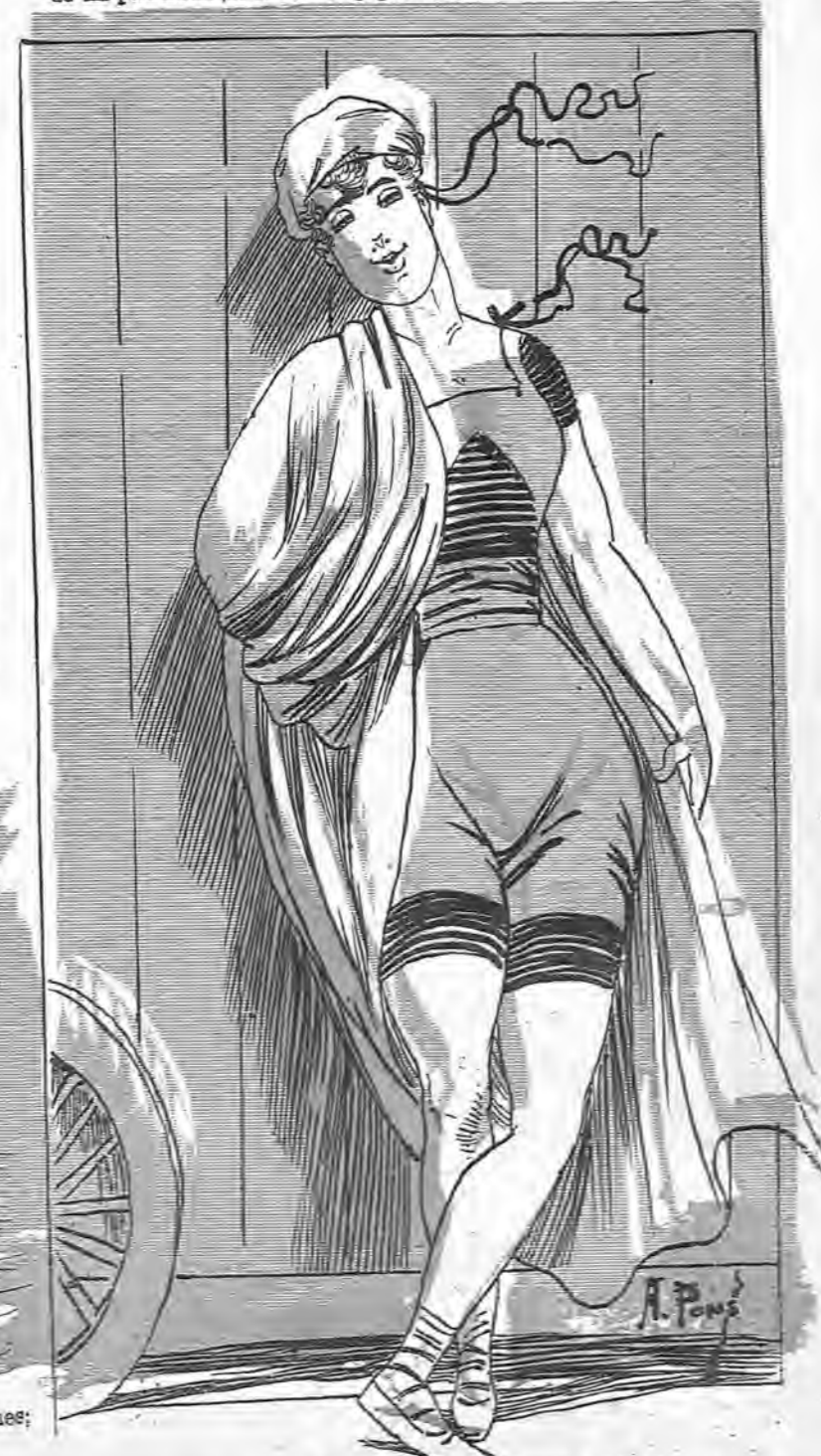
—Hasta el año que viene, caballeros. A Madrid me vuelvo, para lo que ustedes gusten.