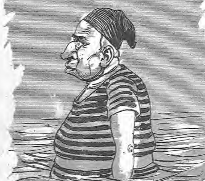
—No comprendo cómo San Antonio resistió las tentaciones; ¡si á mí me dijeran buenos ojos tienes, nada más!...