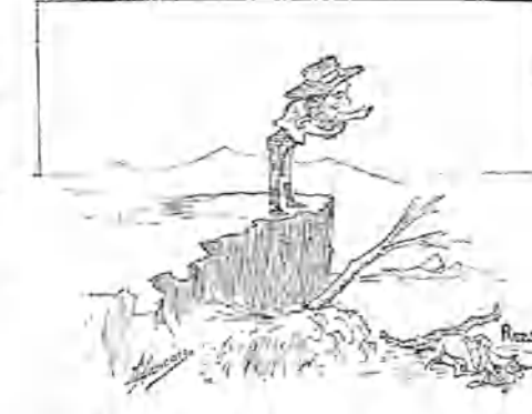
6.—Ha resultado como yo me esperaba, piensa el intrépido boer, y, dirigiéndose al jinete: Adiós amigo... Salisbury —le dice— ¡que no sea cosa de cuidado!