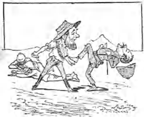
1.—Cobardemente acosado por tres ingleses, pronto se hace dueño del campo, sin más averías por su parte que el haberse quedado sin armas.