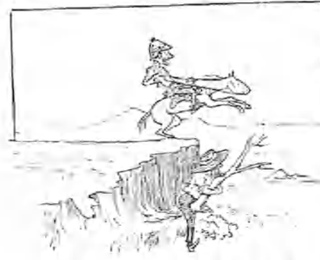
5.—Conocedor del terreno, teatro de la acción, se dirige á un derrumbadero, donde se oculta, y el del caballo no puede detenerse, dada su vertiginosa marcha.