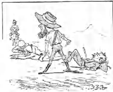
2.—En estas condiciones, ve venir hacia él un soldado de la caballería enemiga, á quien no puede hacer frente, cuya circunstancia le pone de muy mal talante.