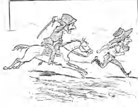
3.—Y no teniendo, por el pronto, un recurso para deshacerse de él, apala á la fuga, llenando á su enemigo de denuestos y renegando de su mala estrella.