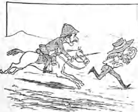
4.—Pero siempre confiado y animoso, despreciando los mal dirigidos tajos de su adversario, le ocurre un medio de triunfar de él, y en seguida lo pone en práctica.