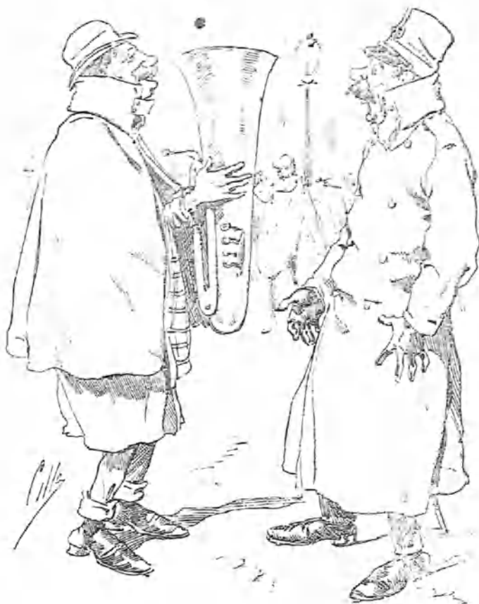
—¿A ver! ¿qué es eso? —¿Desea usted la Marsellesa, el himno de Riego ó la marcha de Cháiz?

Miss' Erere ha recorrido casi toda España ya y nadie le ha puesto sello de ligera ni inmoral . Pero es que á mí los alcaldes me tienen rabia quizá por la parte que me toca en la popularidad del alcalde de Pucela , que es un hermoso ejemplar de alcaldes brutos... ¡y es claro, la clase lo lleva á mal, y al ver Los africanistas se ofende su dignidad! Pero, en fin, yo estoy contento