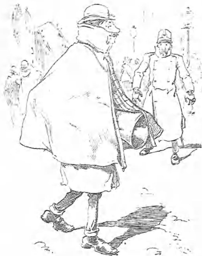
—El se oculta y se tapa. —¿Qué llevará debajo de la capa?