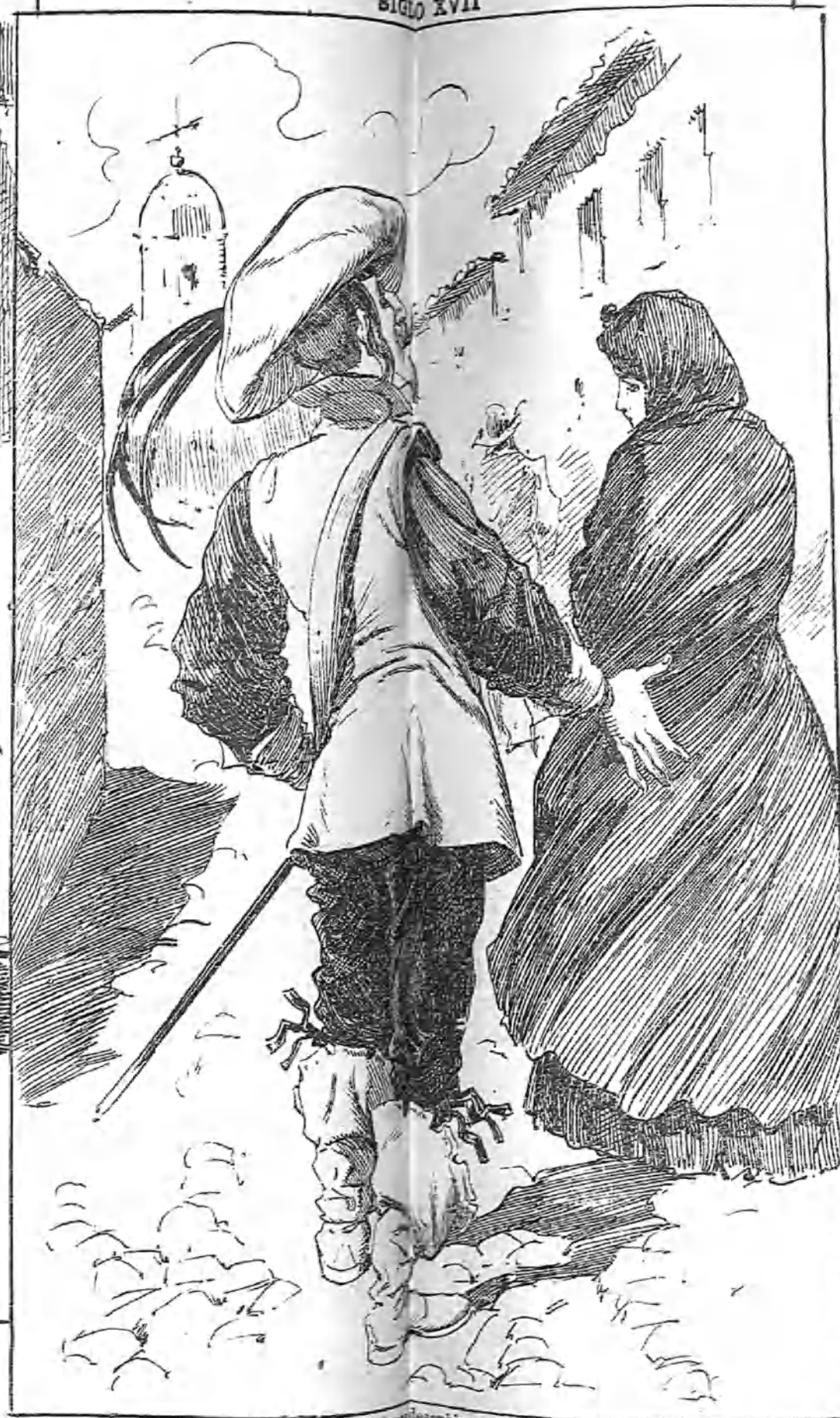
—Con haber desabierto más habéis puesto vos, pues me habéis puesto de cierto, y daréis cuenta al muerto a la justicia de Dios.