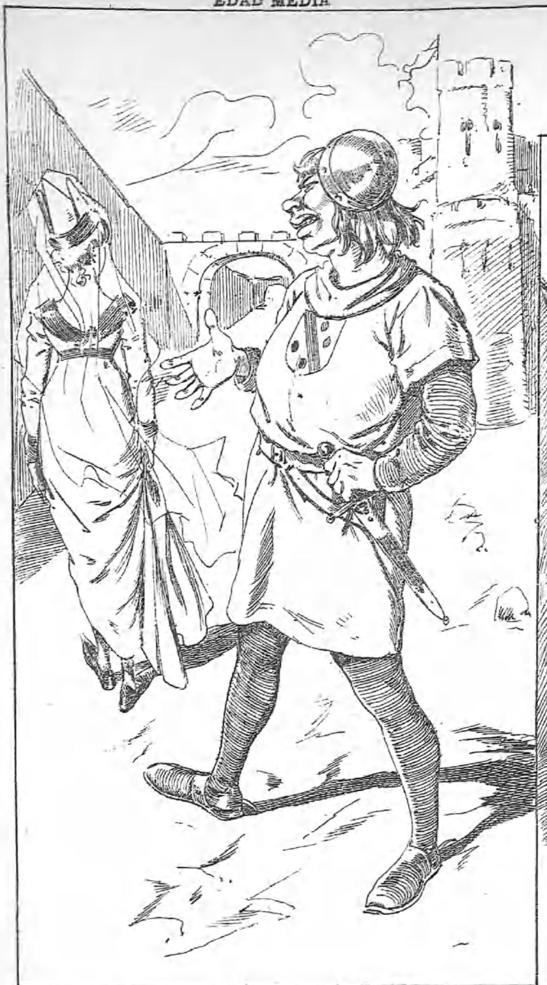
—Si fuera conde y saliere de como el conde al campo sale, traería doscientos moros para que vos los pisáredes.