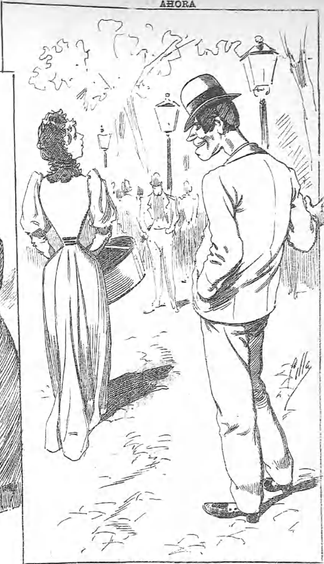
—Vuelva usted por acá en cuanto deje ese bulto, joven, que tengo que decirle a usted cuatro cositas al oído izquierdo.