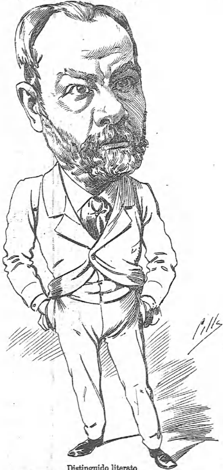
Distinguido literato que trabaja y vale mucho, y ha traducido las obras completas de Víctor Hugo.