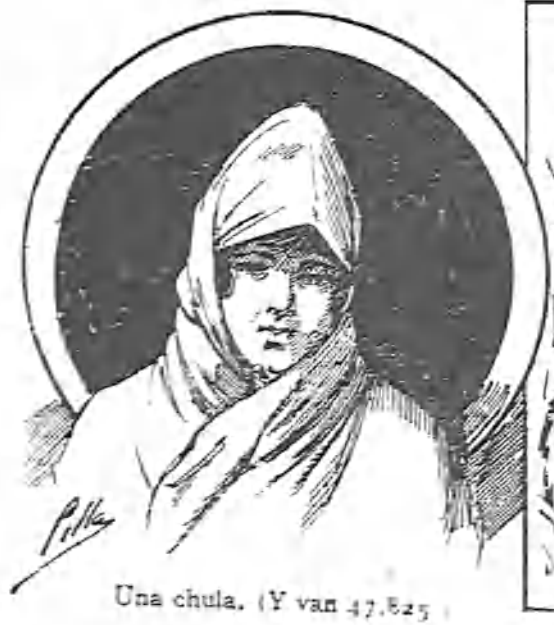
Una chula. (Y van 47.825)