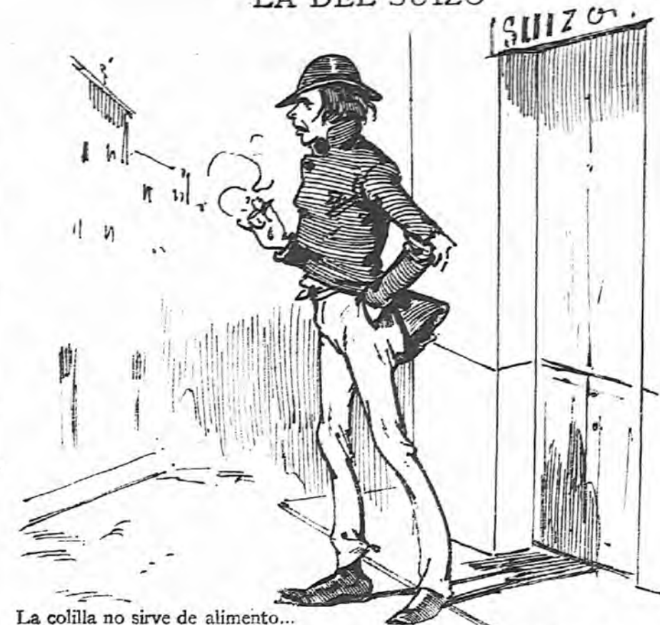
LA DEL SUIZO

La colilla no sirve de alimento... ¡Al primero que pase lo reviento!