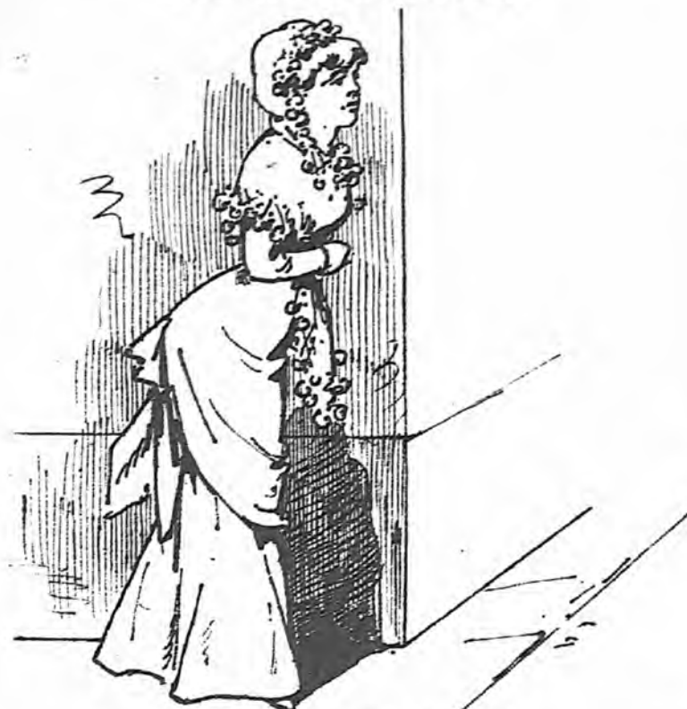
LA DE PELIGROS

Modelo de inocentes querubines que habitan en la calle de Jardines.