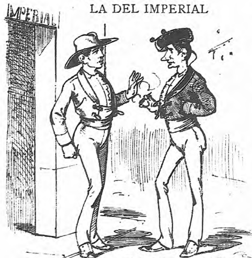
LA DEL IMPERIAL

—Yo no he zacao del arte má que un puntazo aquí, zarva la parte