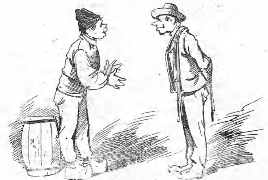
El de Leizaola -