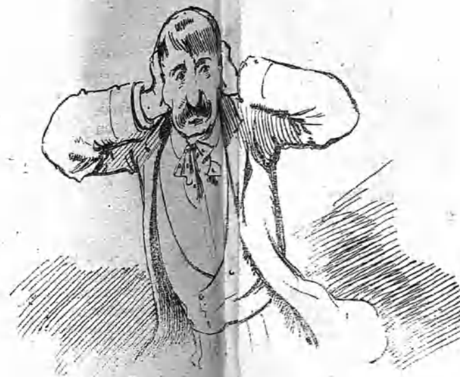
El de León y Castillo -