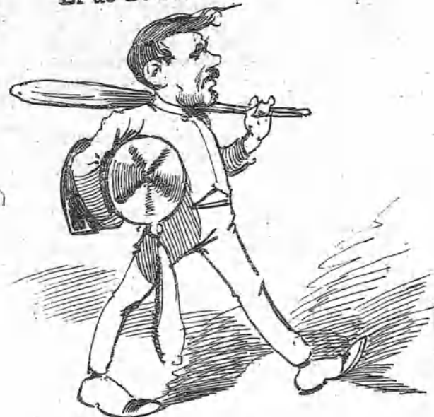
El de Sagasta -