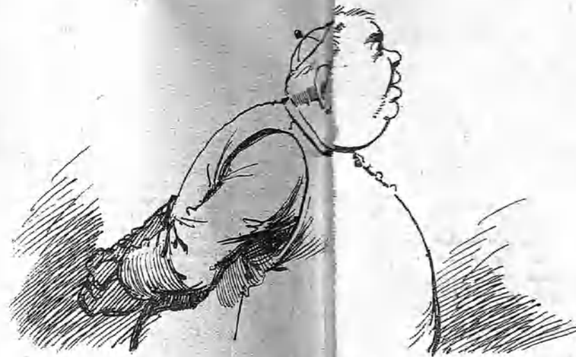
El de Pida -