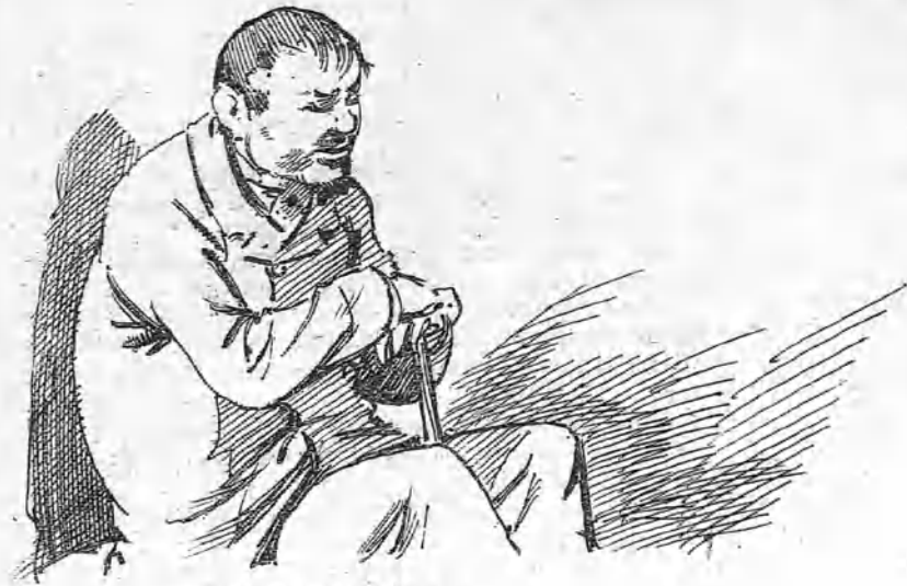
El de D. Pio -