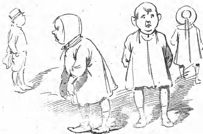
El de Moret -