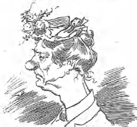
Dicen que hay mujeres solteras á las que los hombres las ofrecen hoteles y coches. ¡Qué mental! Porque aquí estoy yo, tan soltera como la que más, y ninguno me hace proposiciones de esa clase.