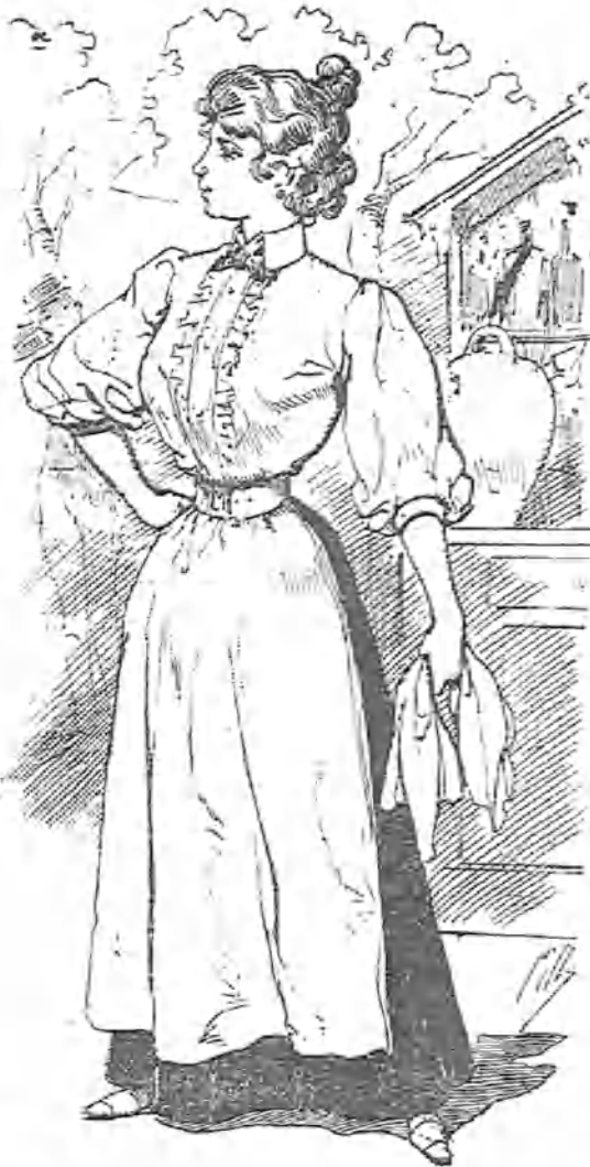
Aunque alguien la requiebre más de lo justo, ni á su pudor le ofende ni la es molesto; y hace cuanto es posible por darle gusto á todo el parroquiano que va á su puesto.