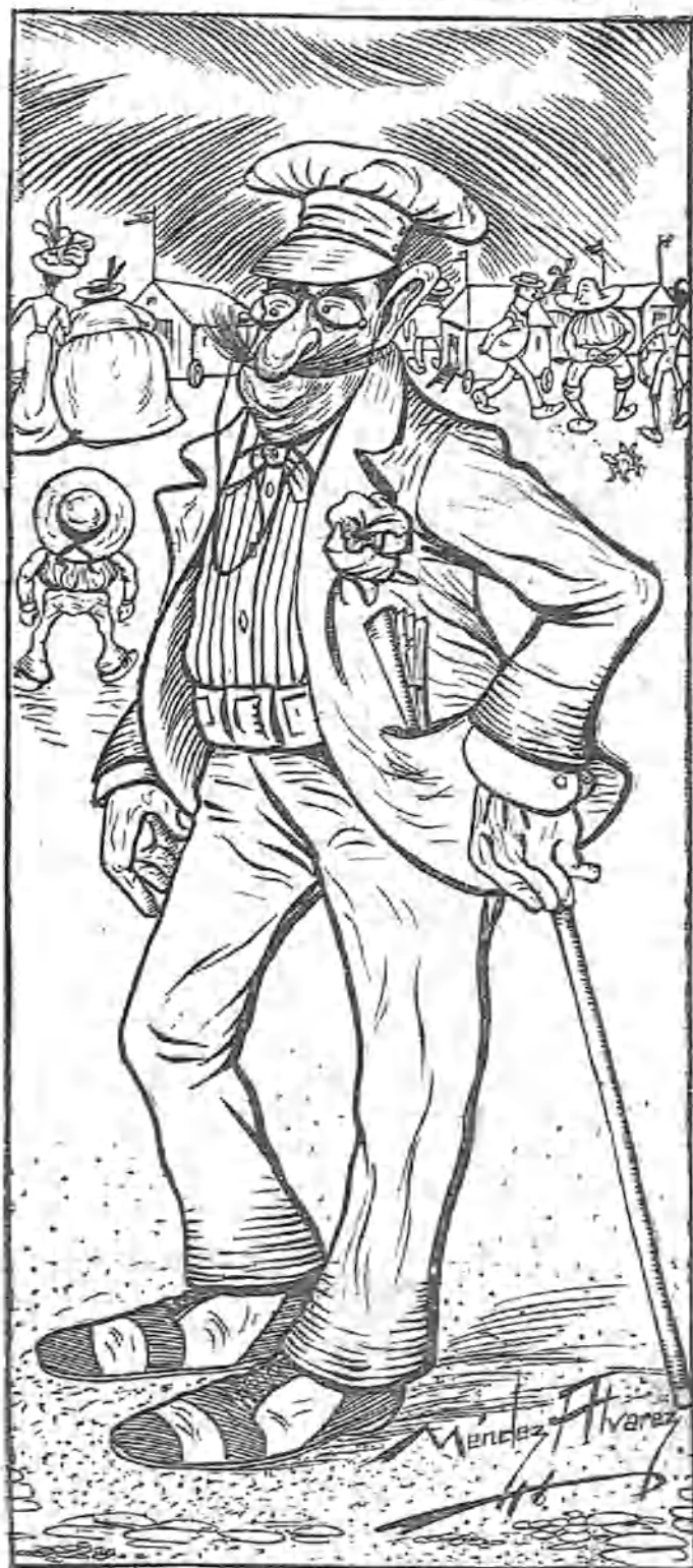
EL TERROR DE LA CONCHA