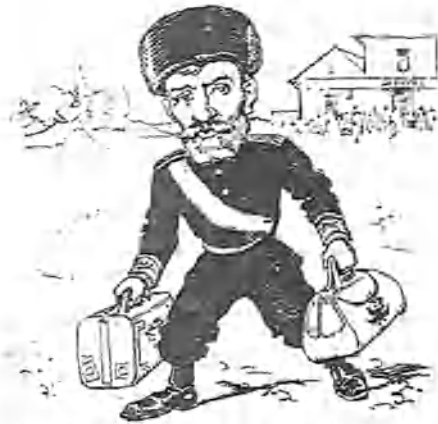
1.—Y acabadas las conferencias de la paz, se marchó el Czar á su casa, diciendo para su capote:—Creo que los he convencido, y desde hoy va á estar el mundo como una balsa de aceite.