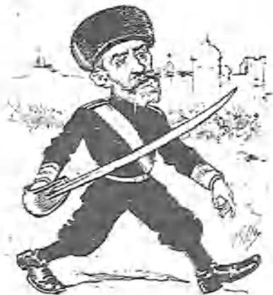
6.—Y el bueno del Czar tuvo que empuñar de nuevo el sable y decirse para su capote:—Me parece que no los convencí del todo; porque el mundo no está como una balsa de aceite, ¡ni mucho menos!