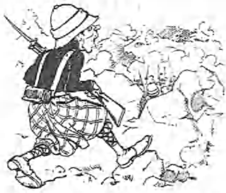
2.—A poco, surgió una ligera escaramuza en el Africa del Sur.