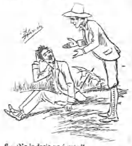
6.—¡No le decía yo á usted!... —Nada, hombre, nada. Era el 5.º y bien sabe usted que no hay 5.º malo.