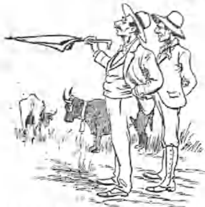
1.—Aquellos dos de enfrente, 1.º y 2.º ¿No le parece á usted? —Muy bien; pero tenga usted cuidado con el quitasol, porque como es encarnado...