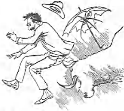
5.—[ . . . . ]