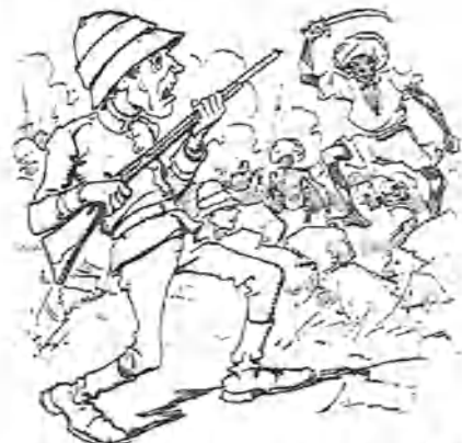
3.—Y otra, aunque sin importancia, en la India.