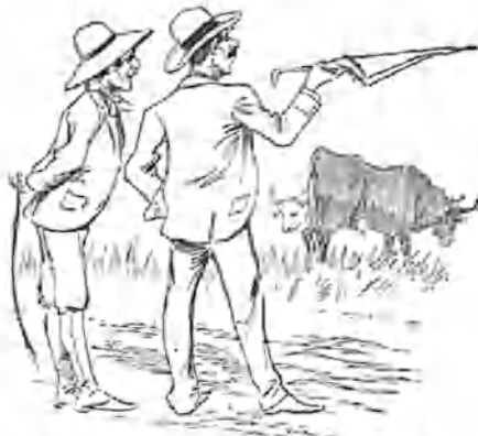
2.—Aquel berrendo en negro, 3.º, y el corniveleto, 4.º —Perfectamente; pero no abuse usted del quitasol...