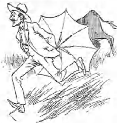
4.—¡Vaya si se nos viene!