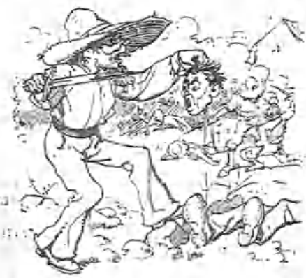
4.—Y otra, y aun otras, en las repúblicas Sud-americanas.