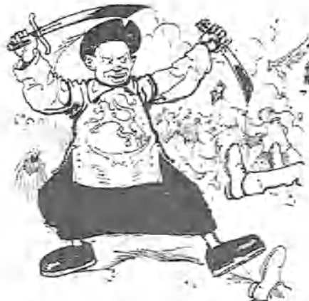
5.—Y una sin importancia en China.