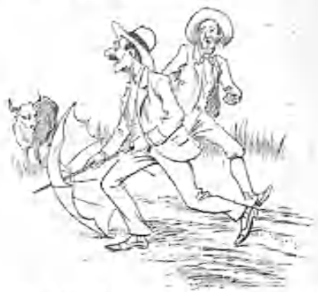
3.—Aquel de la izquierda, 5.º... ¡Caracoles! ese se nos viene encima.