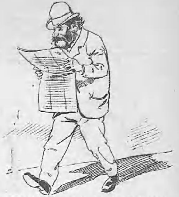
—Hay que ahogar en ríos de sangre la serpiente de la burguesía que alimentamos jimbéciles! a costa de nuestro propio trabajo.