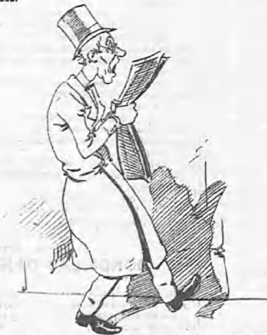
—«El asesinato, el robo, el incendio... ¡Todas las armas son buenas...»