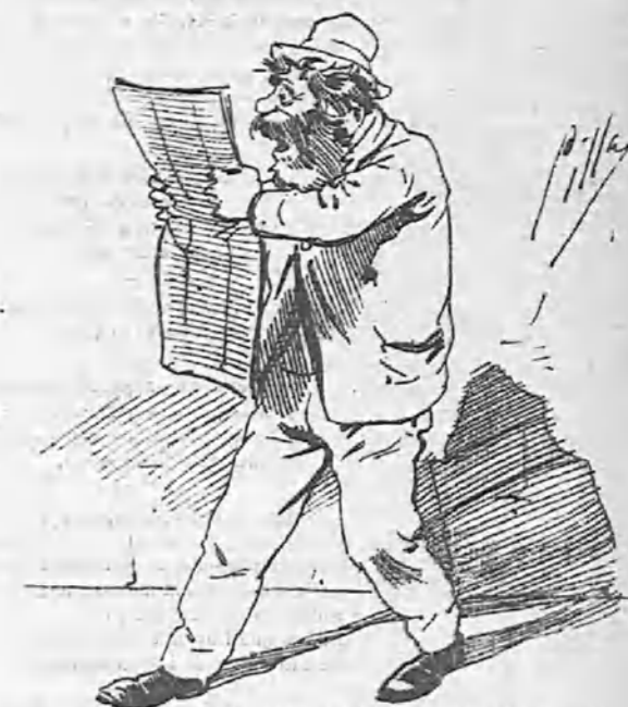
—«Y no faltará quien aplique el hierro candente al cáncer del anarquismo...»