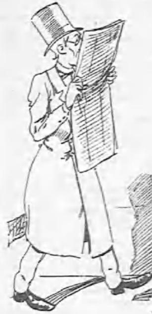
Etcétera, etcétera, etcétera, etcétera.