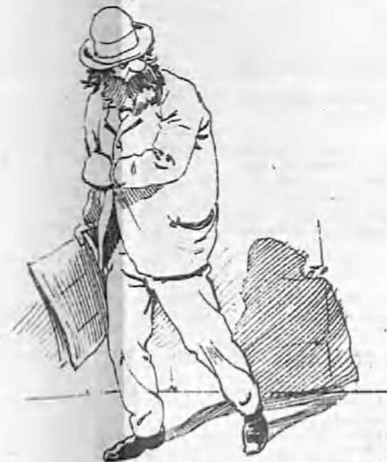
—¡Así te hubieras roto las narices contra una esquina!