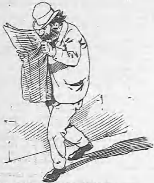
El asesinato, el robo, el incendio... ¡Todas las armas son buenas cuando se trata de regenerar esta sociedad de canallas y de sinvergüenzas!