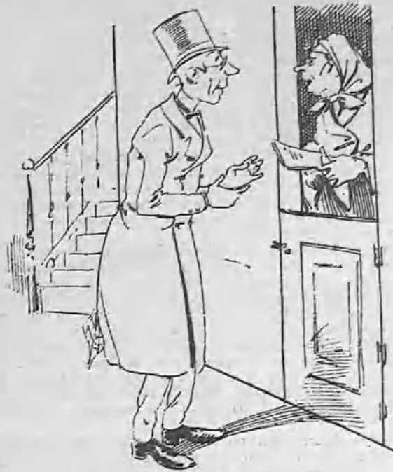
—¿Me han traído El Correo Español ?