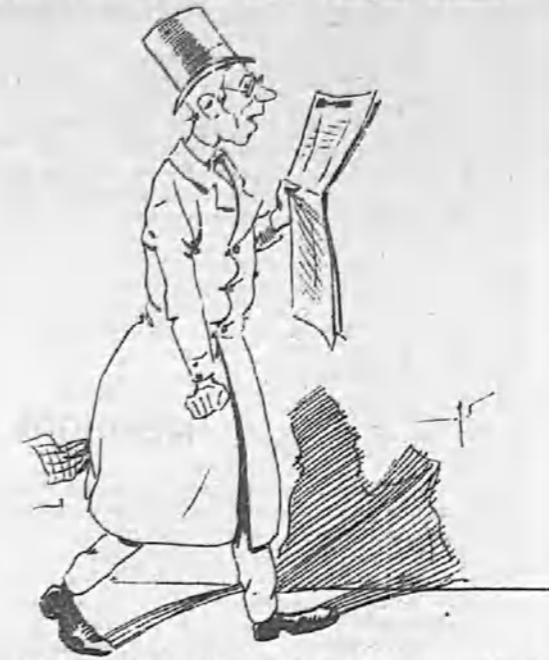
...y no faltará quien aplique el hierro candente al cáncer del anarquismo que nos amenaza con sus brutales excesos...