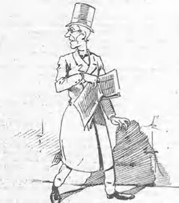
—¿Dónde tendría los ojos el demonio del hombre?