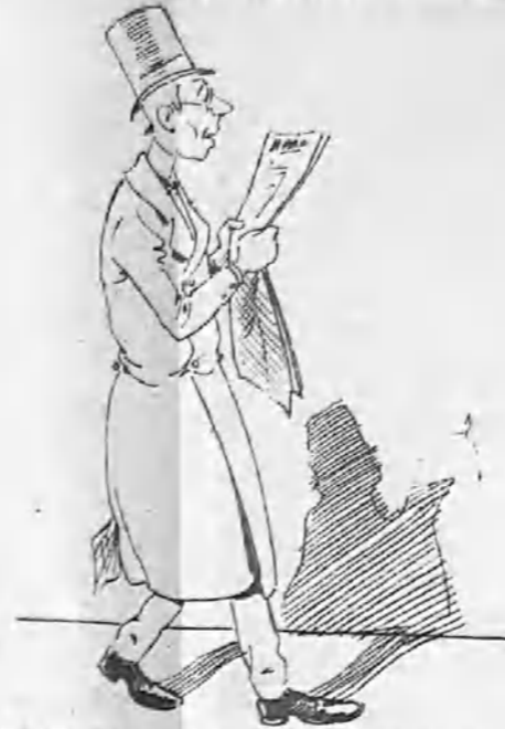
—Por fortuna está para concluir este periodo de desquiciamiento, producido por el predominio de la demagogia insensata...