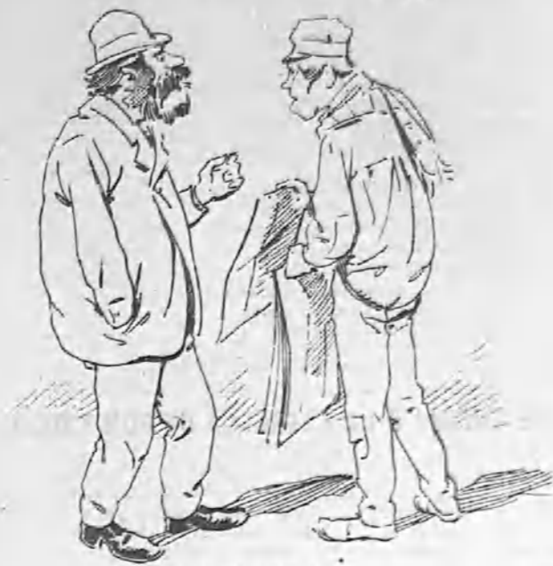
—Deme usted El Anarquista .