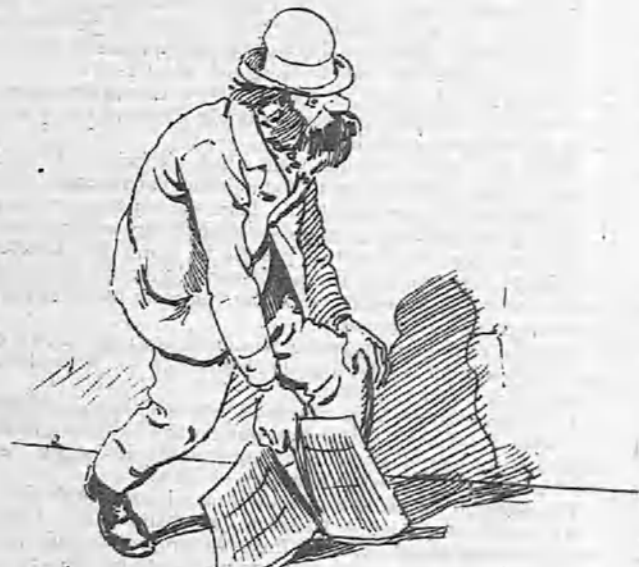
—No hay de qué.