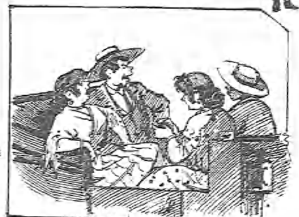
¡Y pensarán acaso los forasteros que aquí ya no hay señoras ni caballeros!