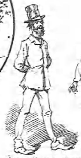
Este tipo es desconocido en provincias y no saben la gracia que tienen!