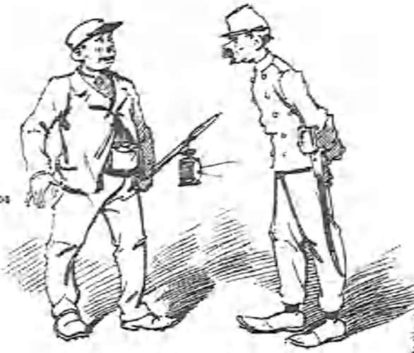
Las últimas capas de la autoridad.