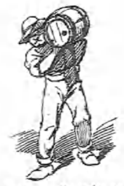
El que hace ruido en las escaleras.