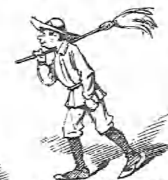
Un individuo del cuerpo de coros... de la limpieza