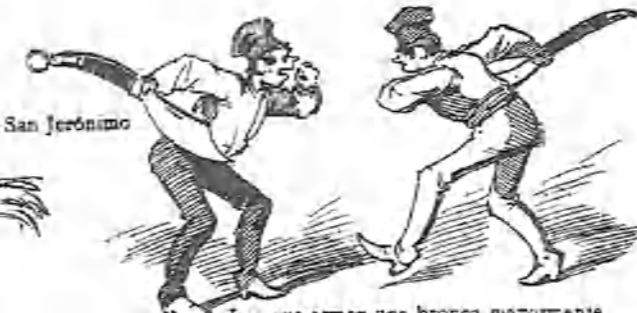
Los que arman una bronca mayormente por cuestión de una copa de aguardiente.