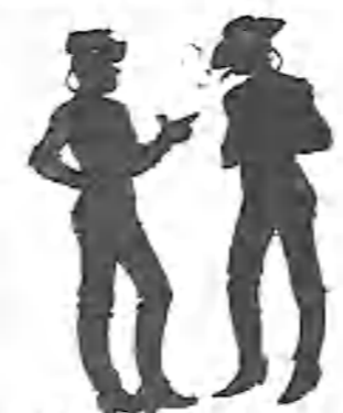
Puerta del Sol, calle de Sevilla, Carrera de San Jerónimo etcétera, etc.