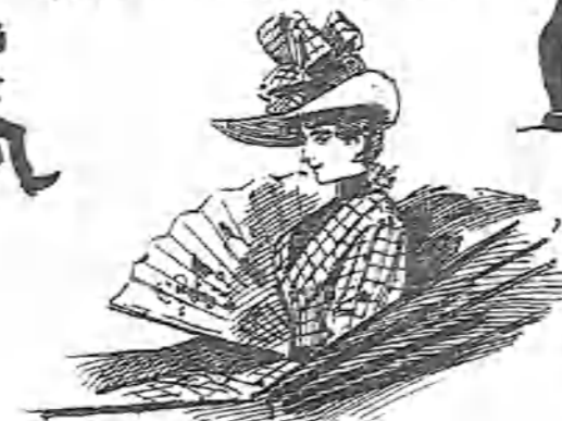
A la corte descalza llegó una noche y ha sido tan amable que tiene coche.