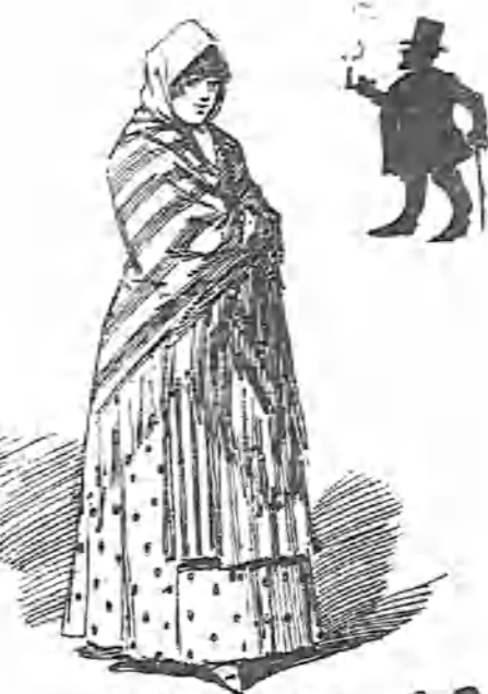
Como haciendo pitillos gana seis reales mantiene dos sujetos sus principales.