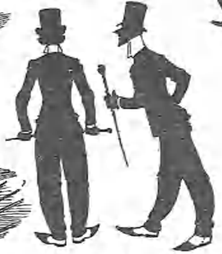
Los ricos adornos de nuestros paseos, que suelen ser tontos y suelen ser feos.