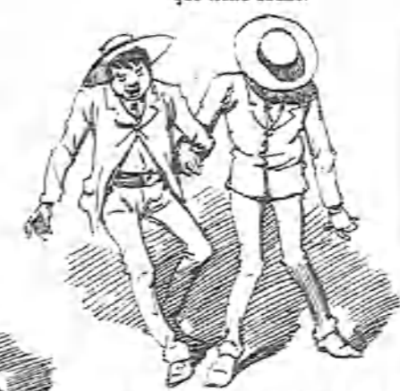
La gracia de los señoritos que se pelean por dinero.