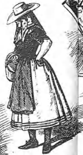
No hay quien no se enamore de la campiña, porque ¡hay cada paisaje! ¡y hay cada niña...