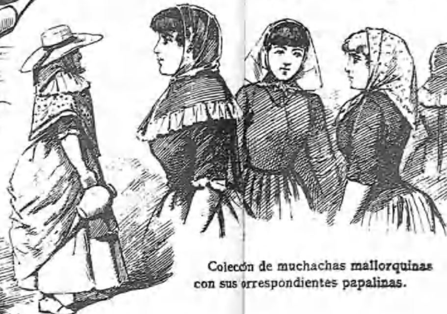
Colección de muchachas mallorquinas con sus correspondientes papalinas.