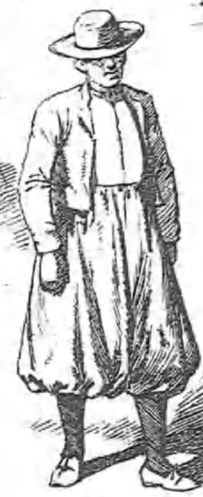
Dos ejemplares del antiguo régimen.