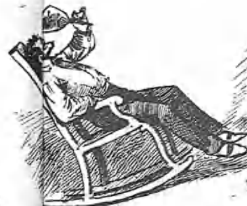
Es Palma de Mallorca país encantador, donde hace á todas horas muchísimo calor.