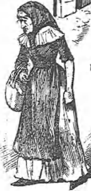
Día de fiesta.