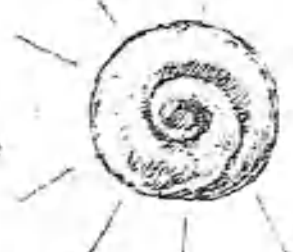
¡Quines ensaimades mes bonas.