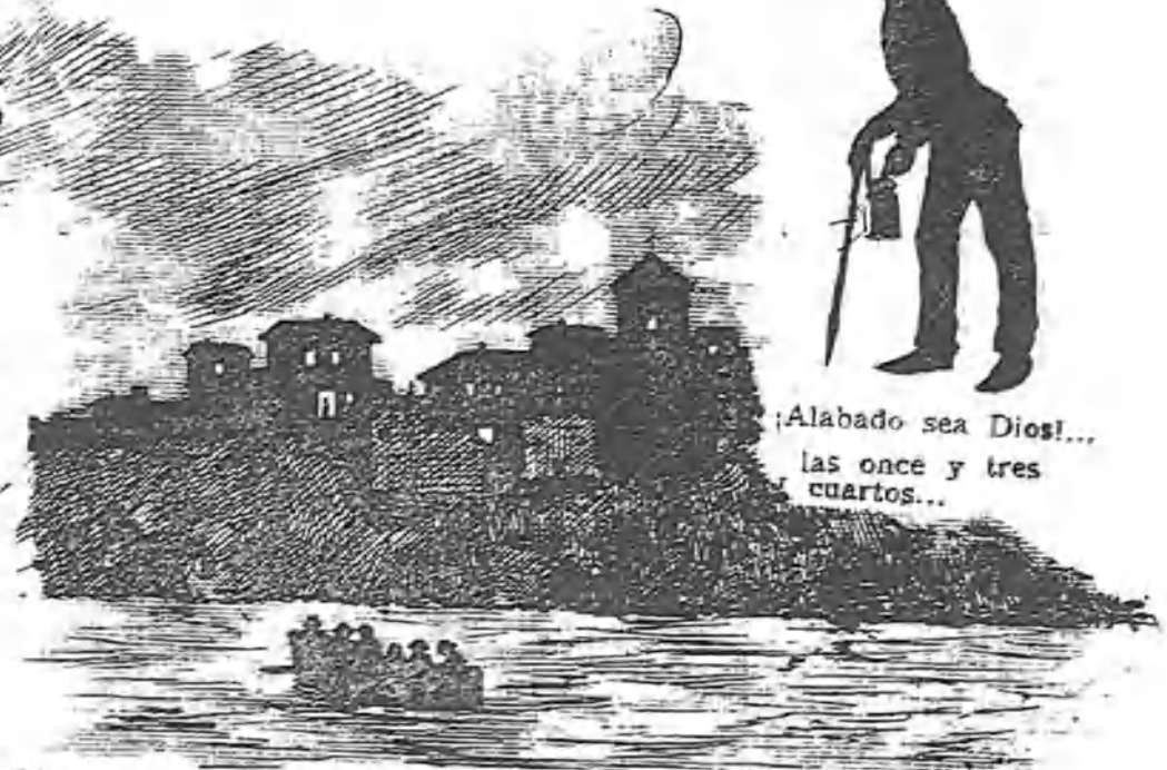
¡Alabado sea Dios!... las once y tres cuartos...