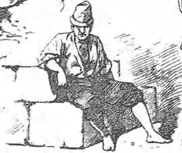
¡No ha pescat ves!