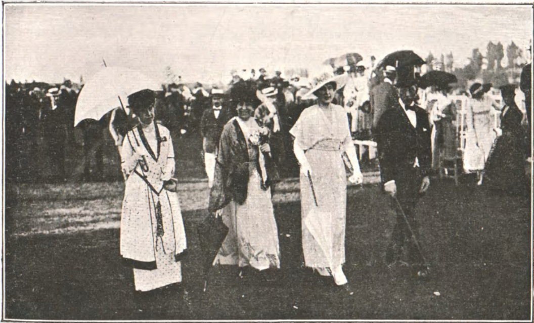
S. M. la Reina Victoria paseando por el Stand del Hipódromo.