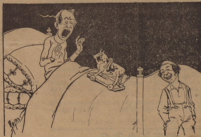
— 6 —