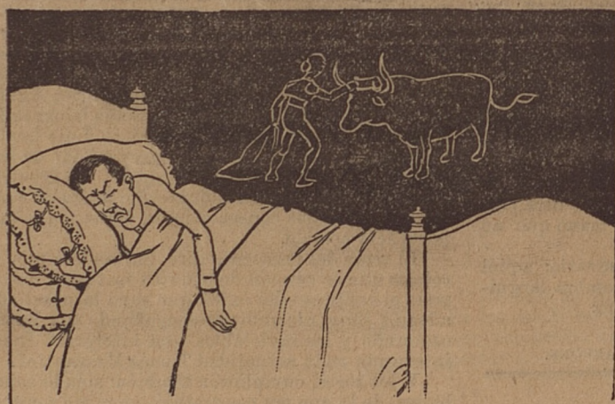
— 2 —