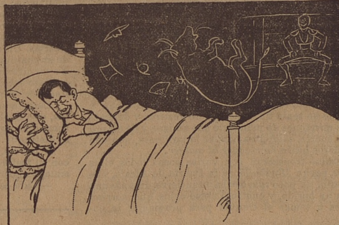
— 5 —