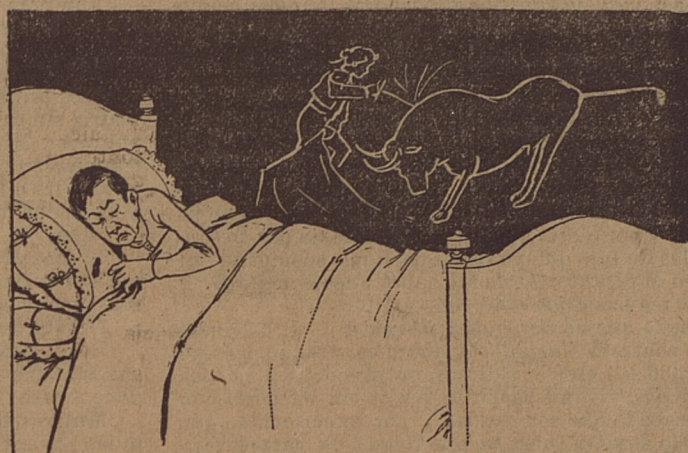
— 4 —