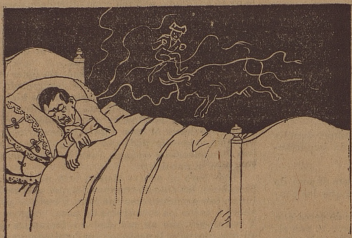
— 1 —

(Historieta muda, pero en toda época de actualidad)