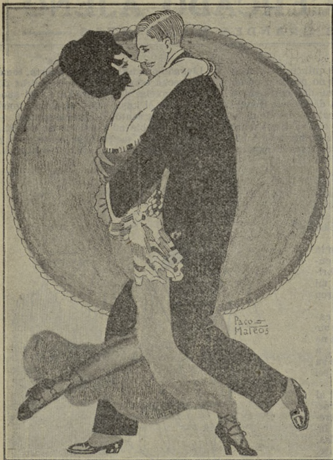
Un aspecto del Tango argentino.

Pasado un buen rato, me preguntó Faifer, con voz dulce: