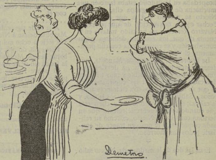
La señora.—¿Pero será posible que entre las dos no sepan hacer una tortilla?