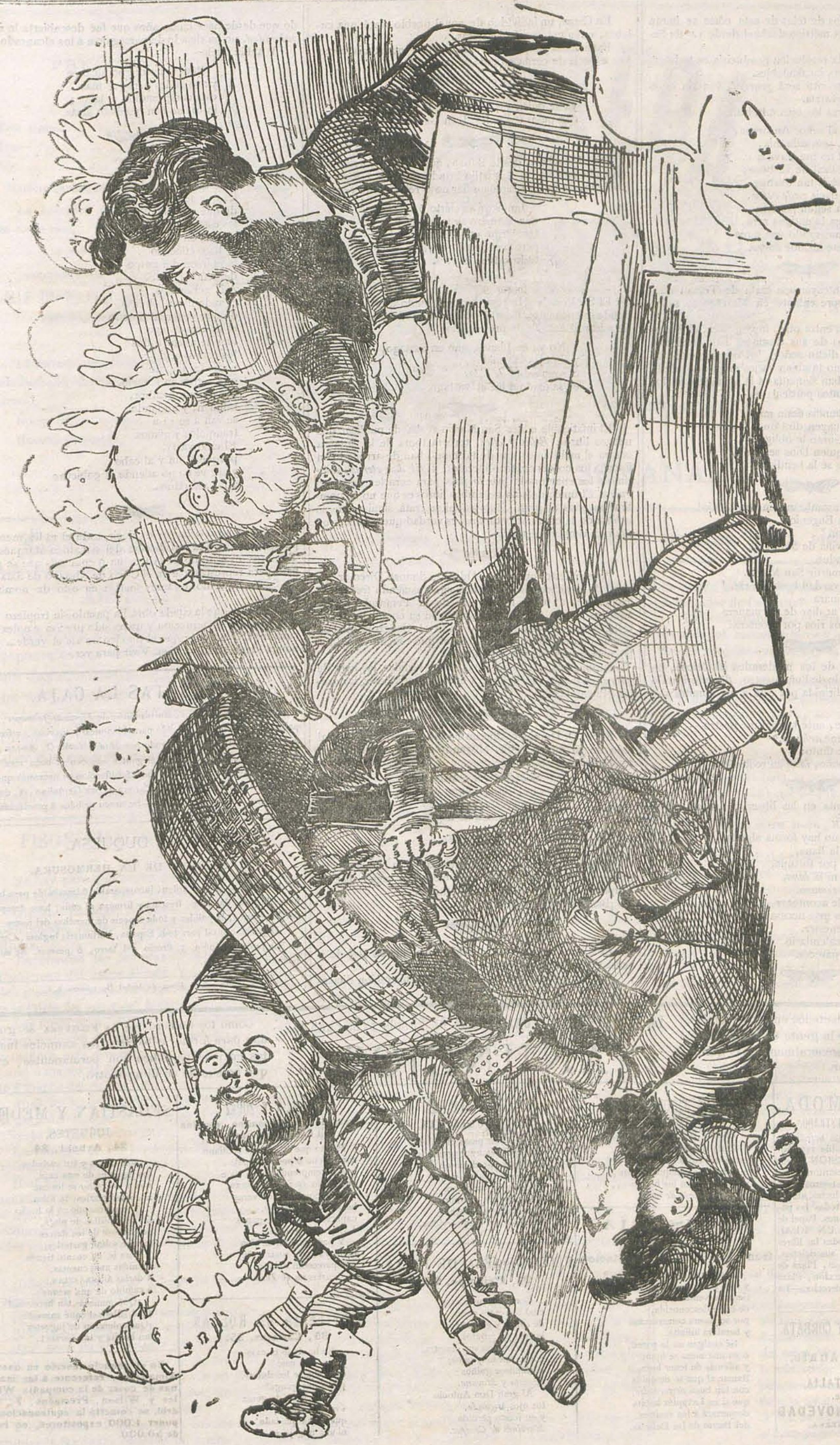
.....y á la segunda embestida no quedó títere con cabeza.....

ARTICULO DE NOVEDAD RECUERDOS DE ITALIA PRINCEPE LI WALTER CAMERIA CUARTER Y CORBATA EL DIA DE MODA