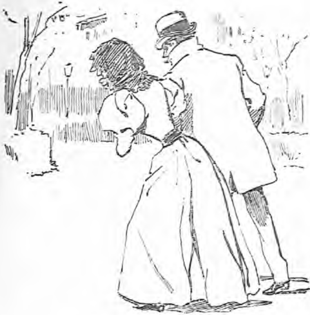
Y Amparo tomó las de Villadiego con el seductor, por no poder soportar la tiranía paterna.