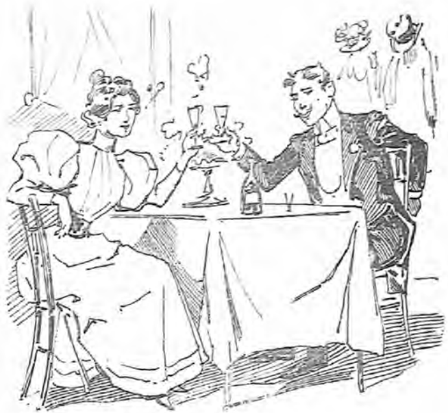
¡¡Y como, dado el primer paso, ya no hay quien se detenga...