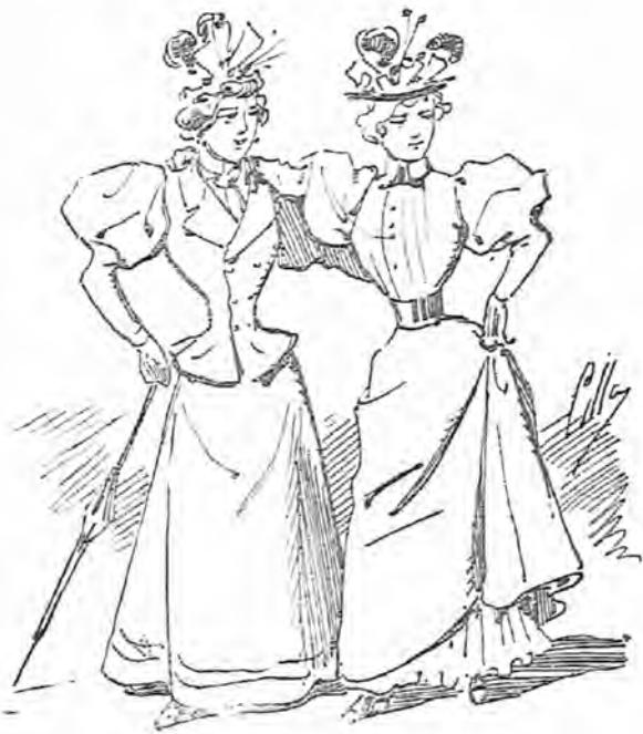
Vinieron, como era de esperar, á encontrarse en un punto. En el punto... y aparte.