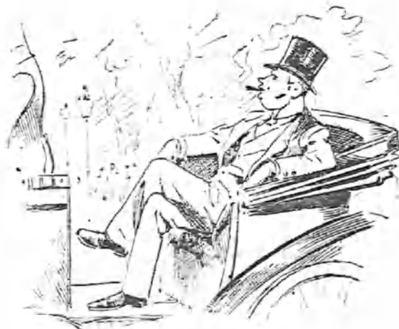
Y así anda desde que se dedicó á robar millones.