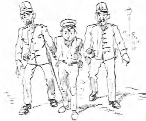
Así andaba por esas calles Colesillo cuando se dedicaba á robar pañuelos.