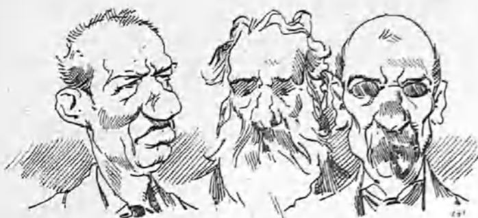
Los que aborrecen la bicicleta con toda su alma.