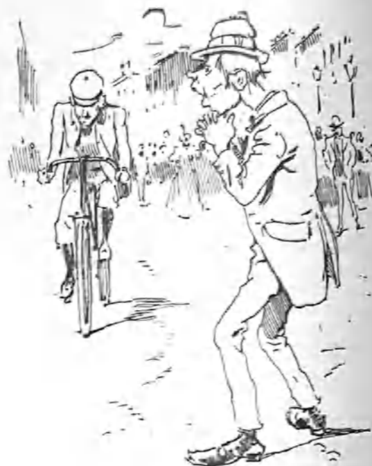
-Si yo tuviera una máquina, unas medias listadas y una pantorrillas... (con que gusto iría llamando la atención por las calles!