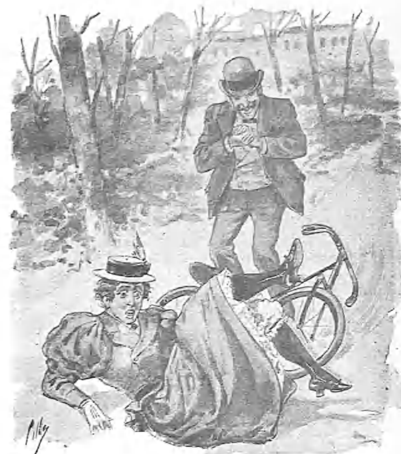
-¿Eh, eh? ¡Ya te las he visto!

món ahora viaja con iniciales, y no hace más que oraciones primeras de activa. Todavía no ha empezado su campaña de otoño y de invierno. Sin duda espera á que llegue el equinoccio de La Epoca, ó á que pase la estación de las lluvias de Martínez Campos.