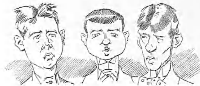
Los que aman la bicicleta sobre todas las cosas.