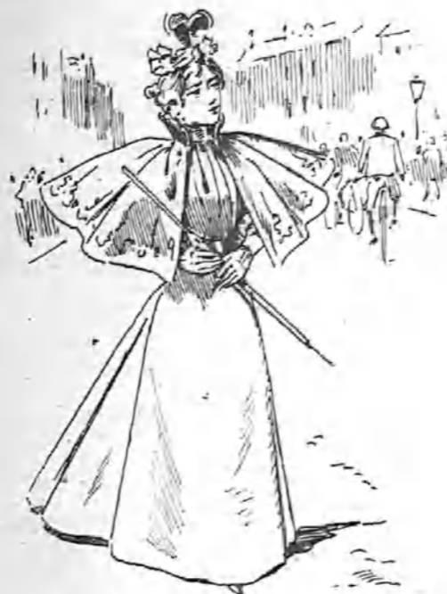
-Entre el pedal de la bicicleta y el de la máquina de coser, me quedo con el de la bicicleta, que siquiera no la denigra a una tantito...