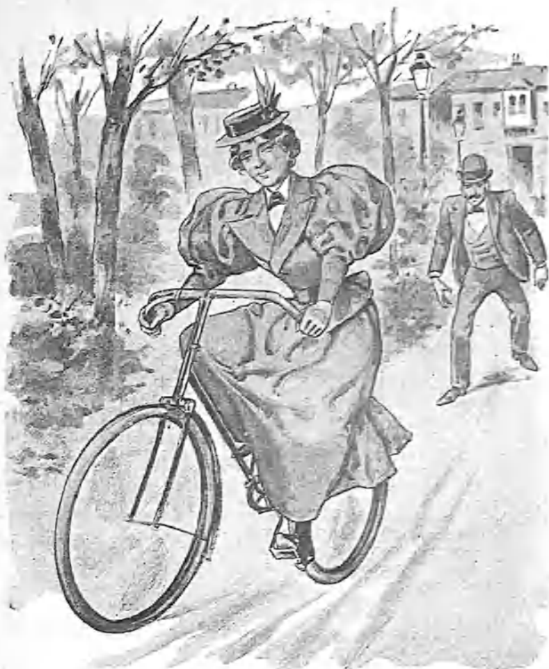
-Yo te las he de ver...