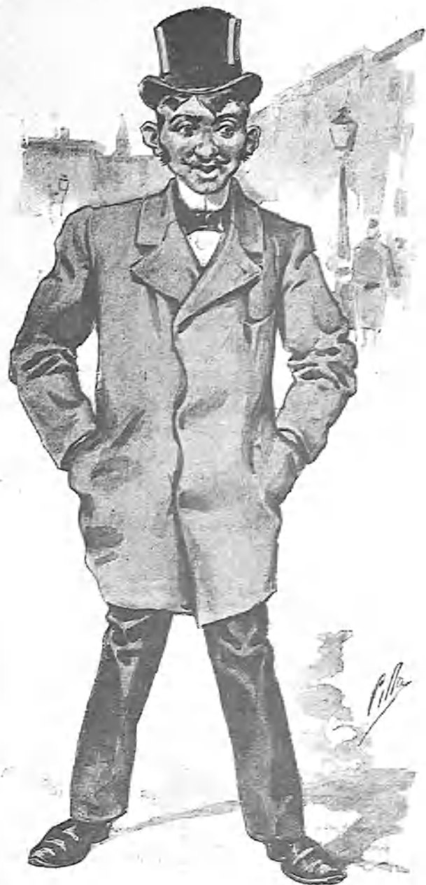
—Aquella es la que me dió el terroncito de azúcar cuando yo iba vestido de perro de aguas. Voy á decirla que no lo olvidaré nunca y que lo llevo cosido en la camiseta...