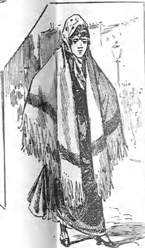
—Si no me quieres me pierdo, me decís al muy cobarde, con su cara de cerdo, y en cuanto pasó la tarde ¡si te he visto, no me acuerdo!