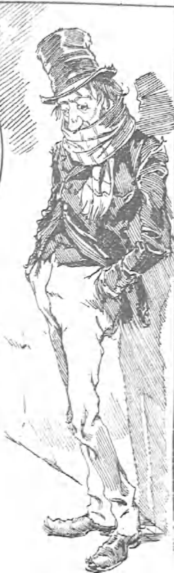
—Todo el año debía haber carrozas... ¡Si- quiera entretendría uno el hambre!