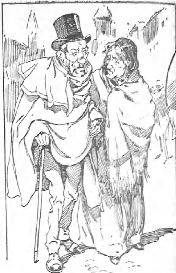
—¿Ves cómo tampoco nos hemos divertido este año?; Y es porque tú yano eres el que eras, Epifanio!