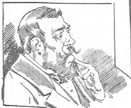
—¿Cuál de aquellas dos máscaras sería mi mujer? Si fué la que casó conmigo, ¡malo! Y si fué la que se marchó con mi amigo... ¡peor que peor!