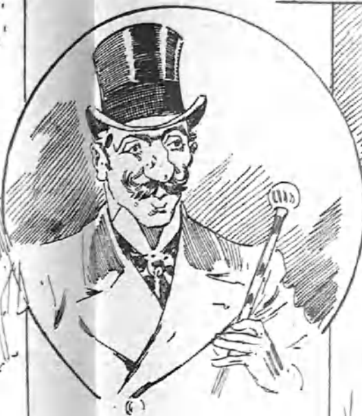
—Todo pasa! Ya ni siquiera me acuerdo del puñetazo que me dieron en las narices junto á la platea número ocho.