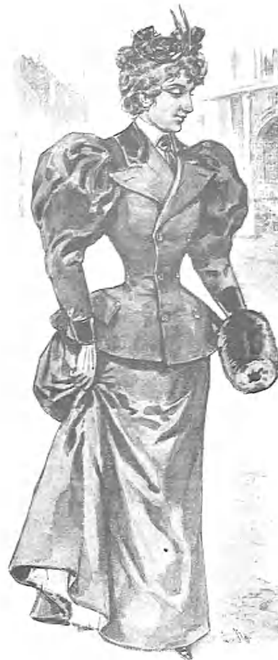
—En estos cuarenta días de recogimiento tengo que pensar la manera de decirlo al confesor lo del baile del Círculo de Bellas Artes, sin que caiga en la cuenta del todo...

encima ó por bajo de la rodilla; conque si de lo que tan fácilmente puede verse tienen tales dudas, ¡figúrate las conjeturas que harán cuando se den á pensar en nuestros sentimientos! Créeme, Pepita, el hombre es un ser físico y hasta moralmente necesario, pero grosero: nuestro espíritu le importa poco, y en cuanto habla de faldas las levanta: lo que le agrada en nosotras es la ó las formas; rara vez se le seduce con el entendimiento: es un mono que devora la fruta sin aspirar su perfume, y así se explica que aun la que anda tirada por la calle suele conservar aroma.