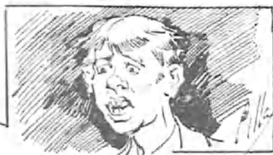
—¡Siempre llueve cuando no hay escuela!