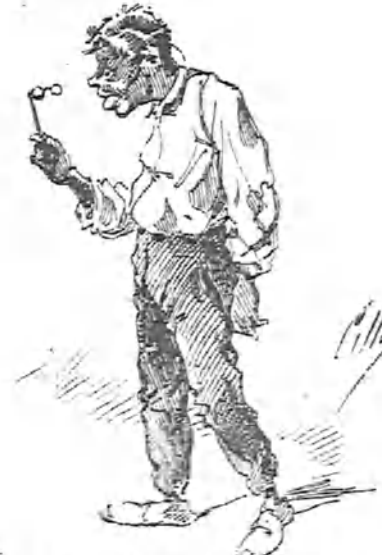
Y el monóculo al chico de la carbonera.