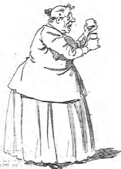
Porque es de advertir que la petaca fue a parar en manos de doña Josefa.