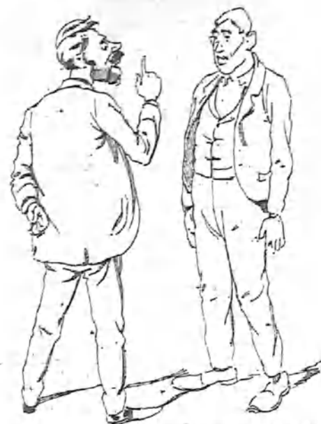
—Vamos a ver, ¿tú tienes buena memoria?