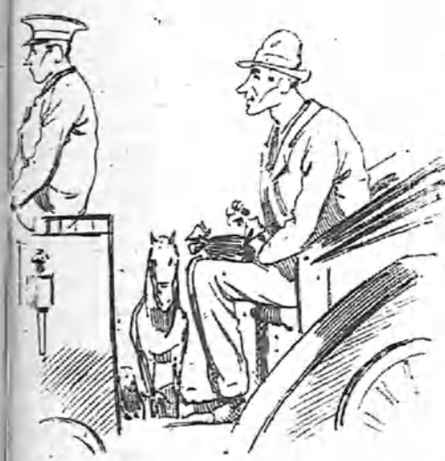
—¡Caramba! El caso es que se me va a olvidar alguno.