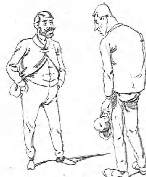
—¿Has hecho todos los encargos? —Sí señor, todos, y se han reído de la ocurrencia.