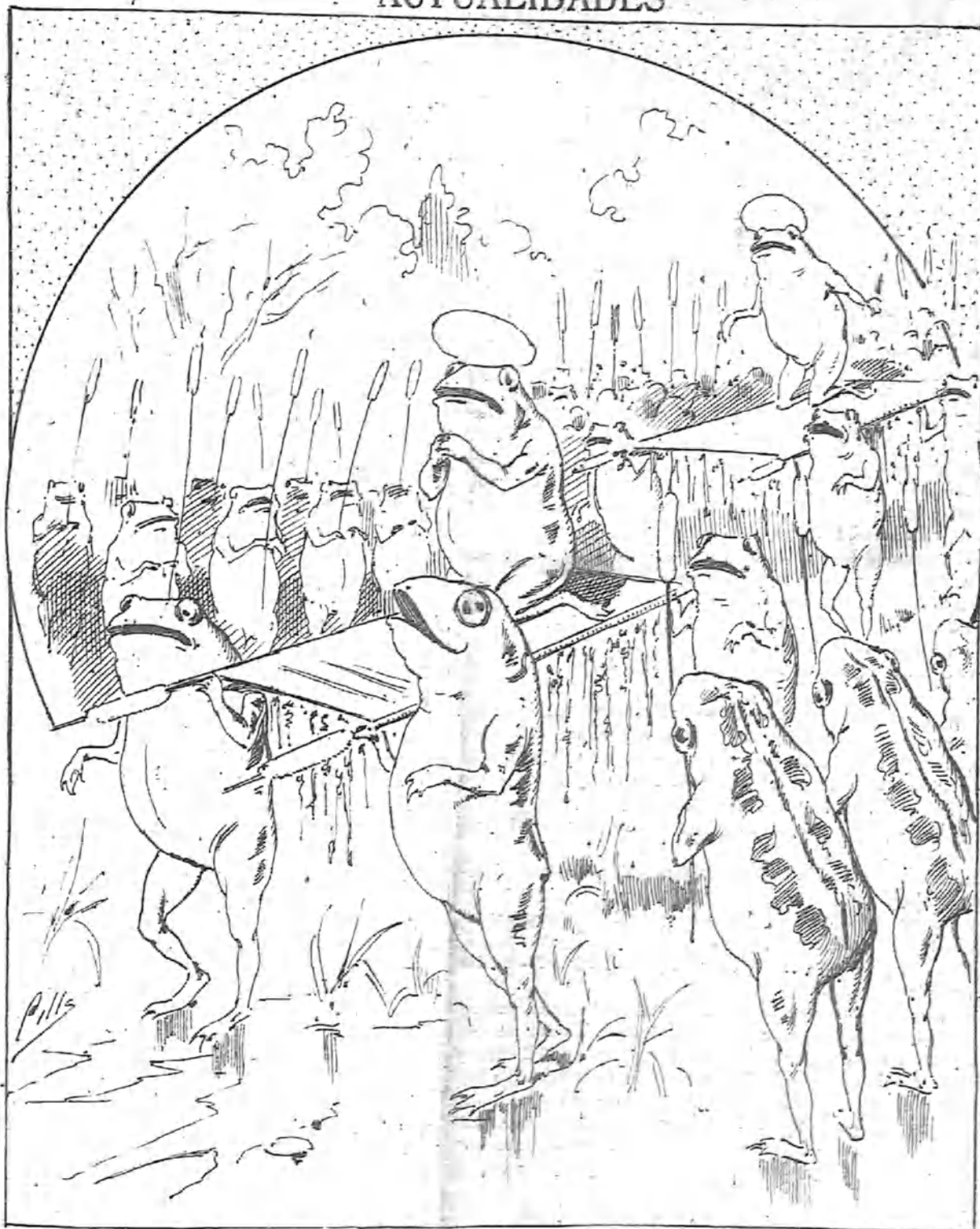
Grandes festejos organizados por las ranas para demostrar su agradecimiento á Jove, por haberles concedido un invierno de los que entran pocos en libra.