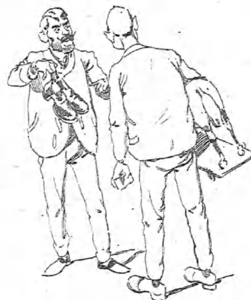
—Y este par de zapatos para mi ahijado, el chico de la carbonera, Mesón de Paredes, 51. ¿Estás enterado?