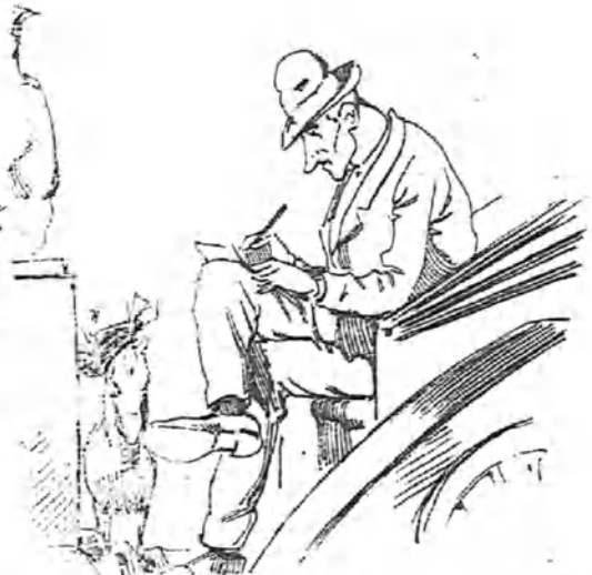
—Voy a apuntarlo y así hago el reparto tranquilamente.