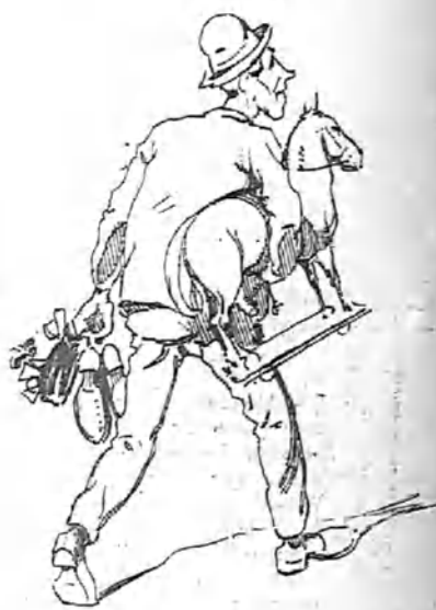
—Pues señor, se me va a caer algo. Lo mejor será tomar un coche por horas, y ya lo pagaré con lo que saque de propinas.