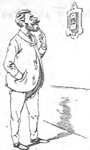
—19 de Marzo. Vaya, no hay más remedio que cumplir con todos los Pepes y Pepas de la familia.