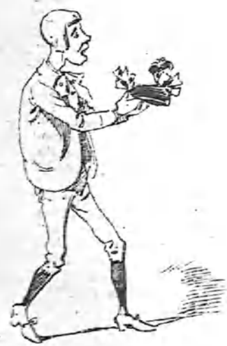
La capota al sobrino Pepito.