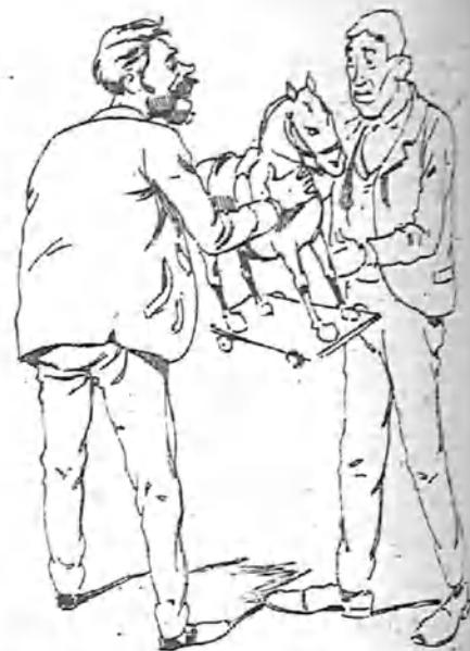
—Pues atiende. Este caballo de cartón para mi sobrino Pepito, Fuencarral, 9.