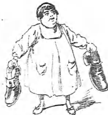
Los zapatos al hijo del primo Rafael.