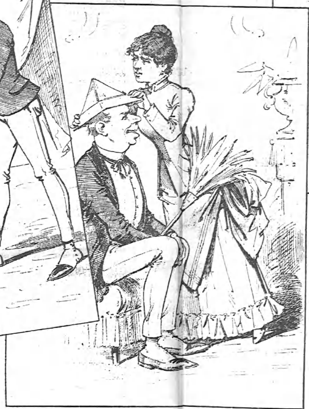
EN LA DE JULIA

—¡Una muchacha sin nombre! ¡no te cases con Emilia! ¡Y el honor de la familia! ¡Y la dignidad del hombre!