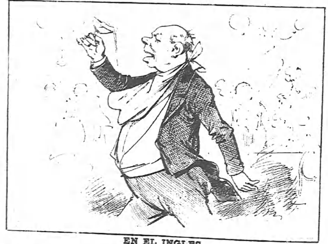
EN EL INGLES

— Tiene vucencia un talento, que es una barbaridad; lo digo como lo siento... (¡y viva la dignidad!)