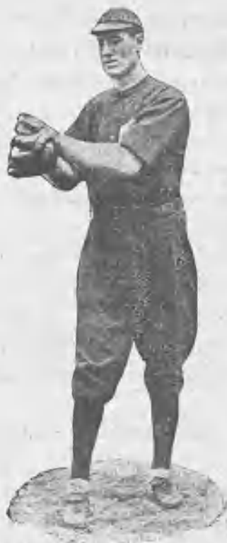
Figuras del Basse-ball.

La segunda parte empieza con bastante suciedad por ambas partes, menudeando