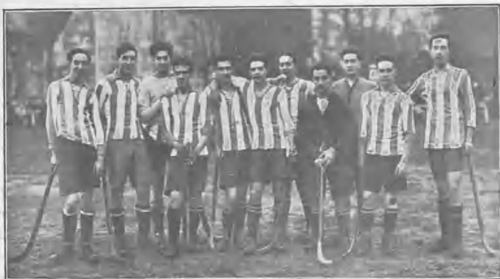
EQUIPO DE HOCKEY-CLUB DE LA REAL SOCIEDAD DE SAN SEBASTIÁN

mos este deporte, en que ya hay un equipo más que, con su entusiasmo, facultades y afición, contribuirá, en San Sebastián, a fomentar la inclinación al hockey, y en Madrid, a realzar y hacer más difícil la conquista del campeonato. Sobre esto no tengo duda; pues los donostiarras, cuyo espíritu deportivo forma ya parte de su carácter, cuando se comprometen a practicar un deporte, se arriesgan en él en todas sus pruebas con un noble amor propio,