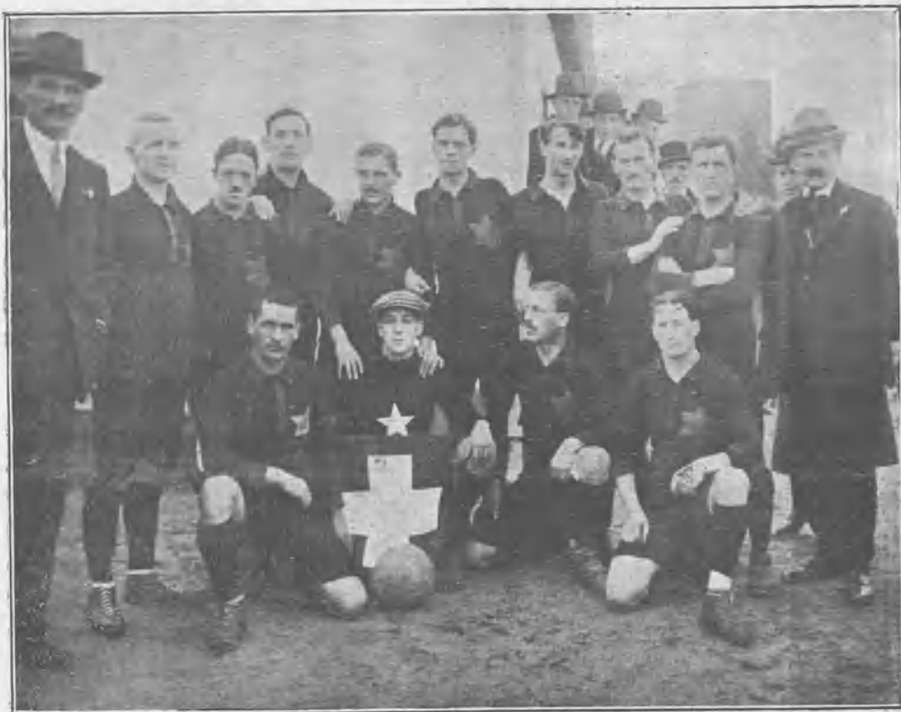
L'Etoile Chaux de Fonds.

Pero fuera descortesía, impropia de castellanos, no tratar de recordaros (a los que los hayáis visto) algunos aspectos del jue-