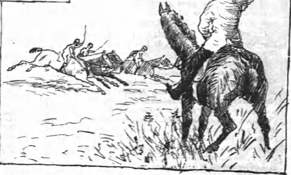
1.—Una apuesta de valor Entre uno y otra se trata; Ella dice: «Soy Traviata», Y él responde: «Yo Traidor».