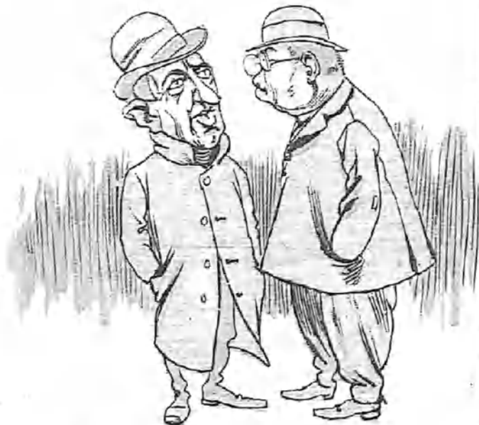
—¿Se acuerda usted de aquel Comendador que hacía yo? ¡Cuando iba en busca de D. Juan con mi hermoes escopeta de dos cañones y mi canana! ¡Aquello era hacer papeles!