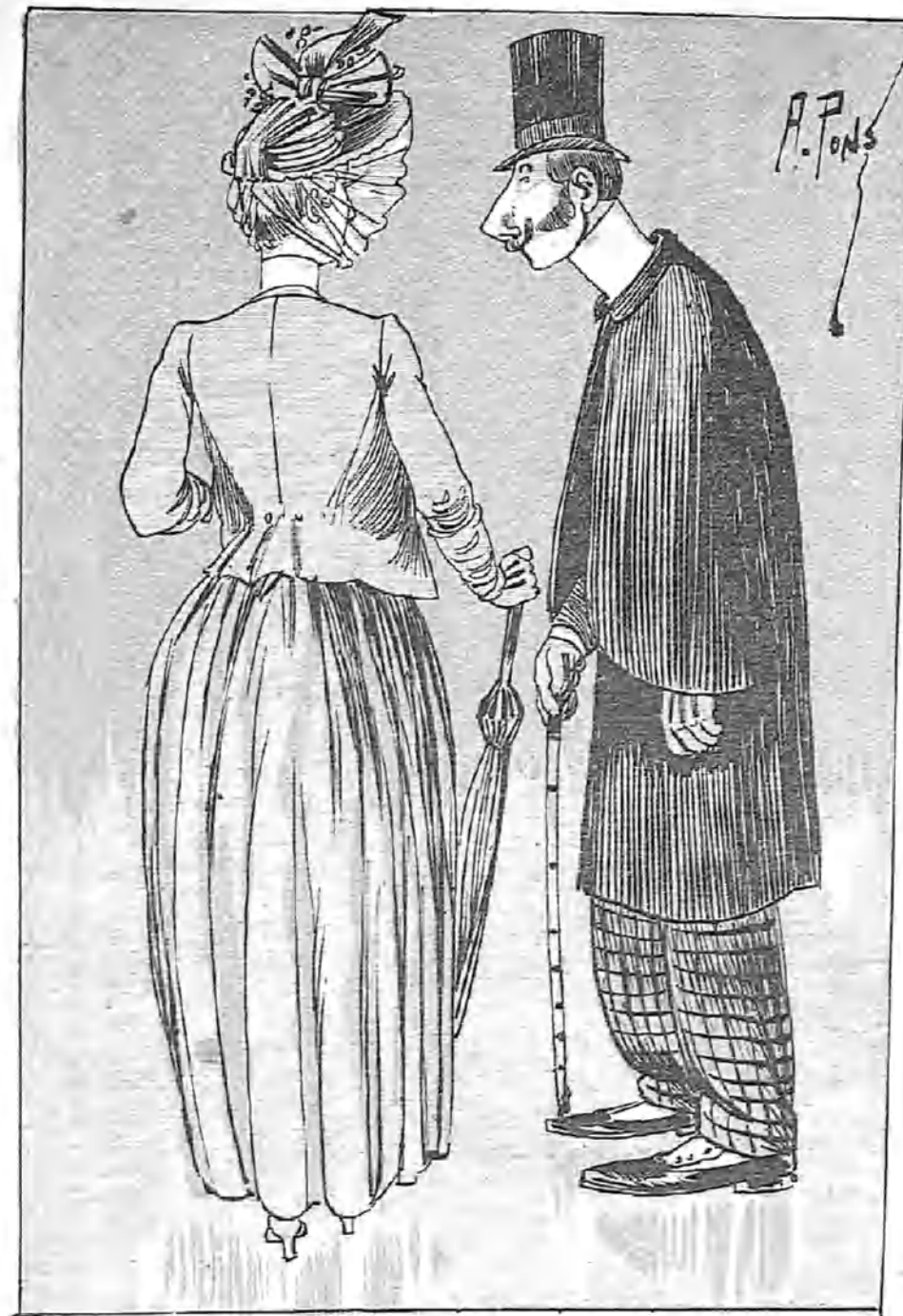
—¡Conque usted es del teatro! ¿Y á qué género se dedica usted? —La verdad, el género que más me gusta es el de los señores de estado, porque los hijos de familia no resultan tanto.