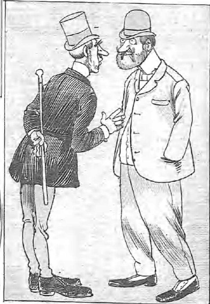
—Mis condiciones son: dos pesetas, ropa limpia, y que los autores me escriban papeles en los que yo pueda cenar en escena. Cena que usted paga, por supuesto.