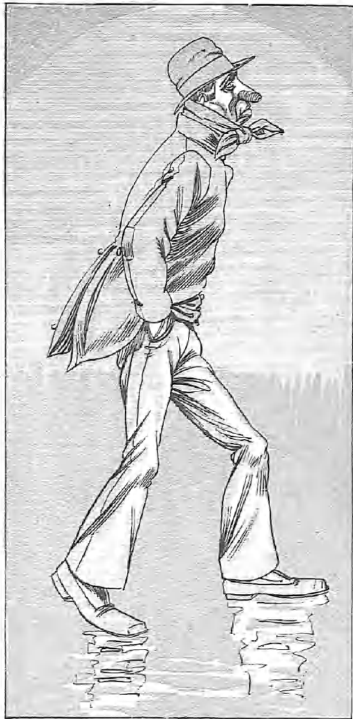
—¡Que yo no sirvo para el Real! Y pá los dos reales, y pá una peseta si á mano viene, que no caerá esa breva.