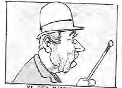
EL QUE HAMBRE TIENE... —¡Parece un empresario!...