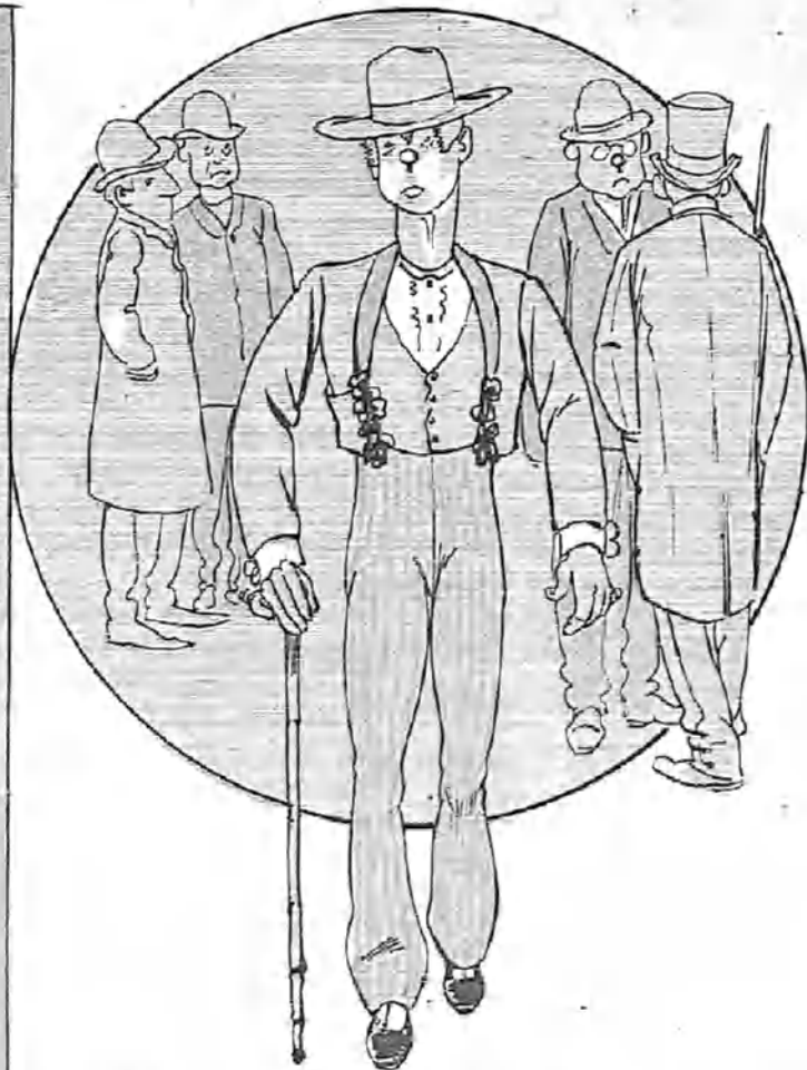
—¡Vamos, que si tea la presencia y presopopeya que me traigo aquí la tuviera en el redondel, no eran trufos los que se ganaba un hombre!