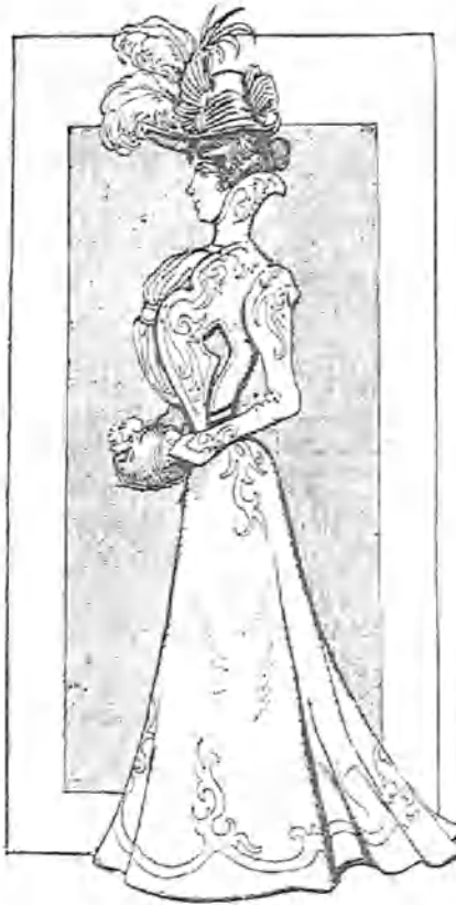
PLATO de CUARESMA.—Anguila.

vados. Y debe importar al Excmo. Sr. Ministro de Fomento; al Ilmo. Sr. Director de Instrucción pública y á las corporaciones contenidas en la siguiente lista: