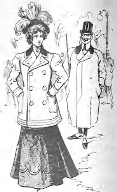
PLATO DEL DÍA.—Trucha y atún.

Quieren unos que los tribunales examinadores se constituyan con individuos del profesorado oficial; desean otros que los forme el personal docente de los establecimientos privados en que estudian los alumnos; no falta quien proponga que sean jueces