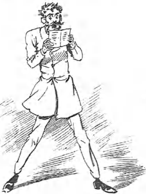
El primer anónimo.