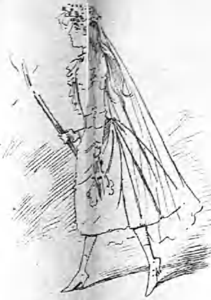
La primera comunión.