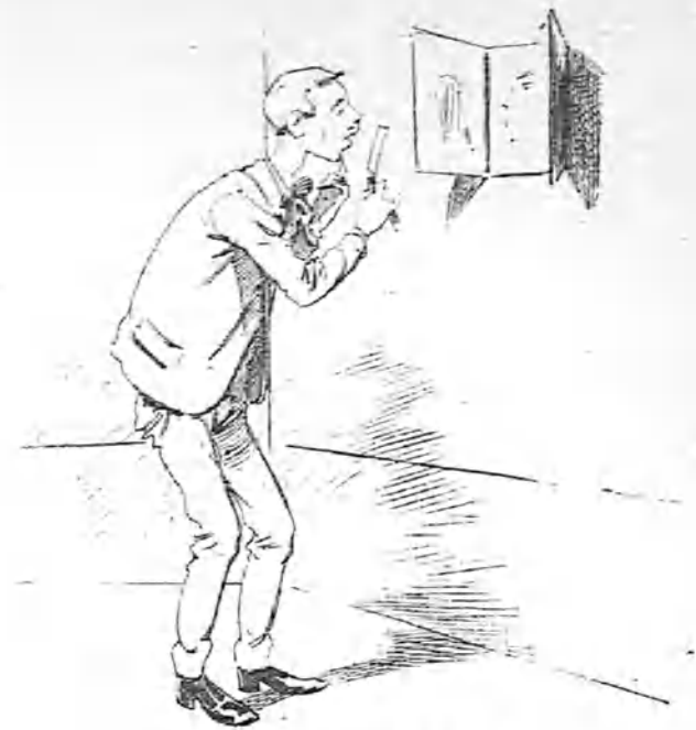
El primer conato de barba.