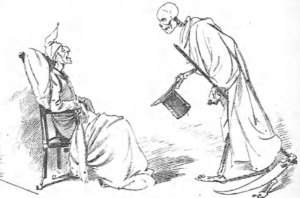
La última visita.