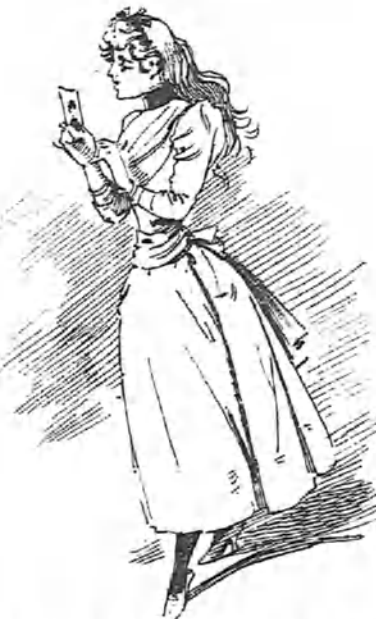
El primer retrato..... con dedicatoria incandescente.