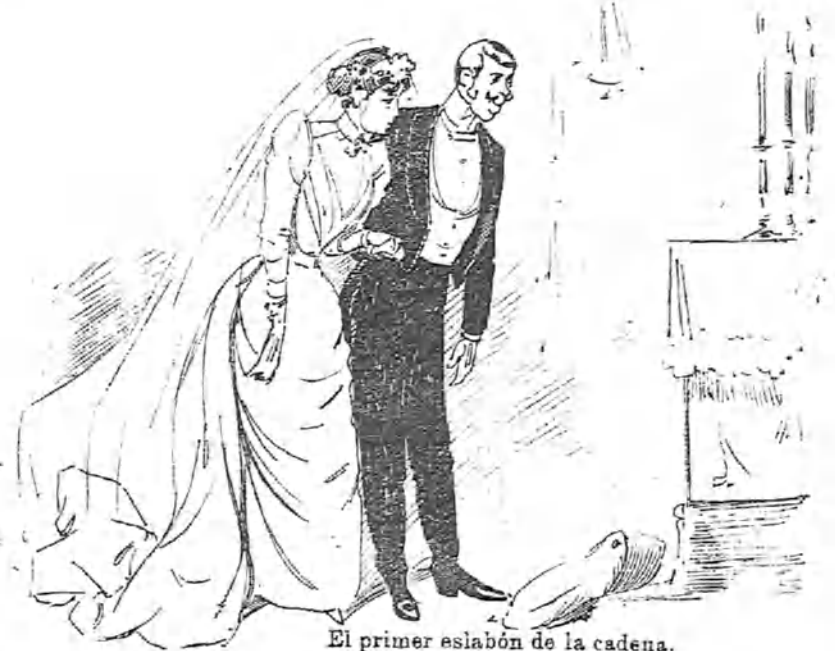
El primer eslabón de la cadena.