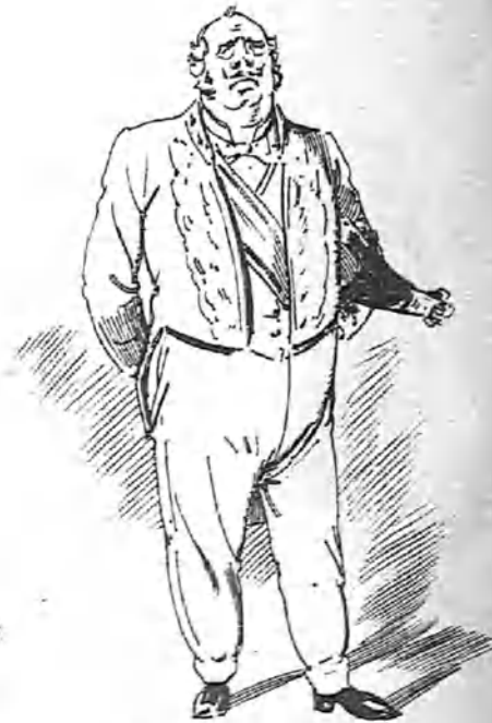
El primer cargo honorífico.