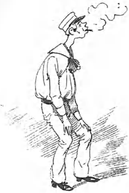
El primer pitillo.