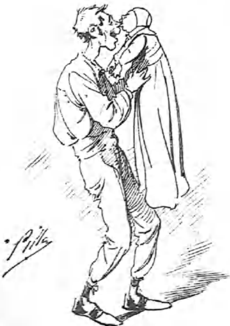
El primer vástago.