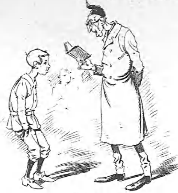
El primer día de escuela.