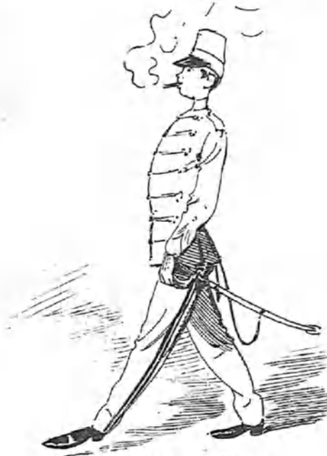
El primer uniforme.