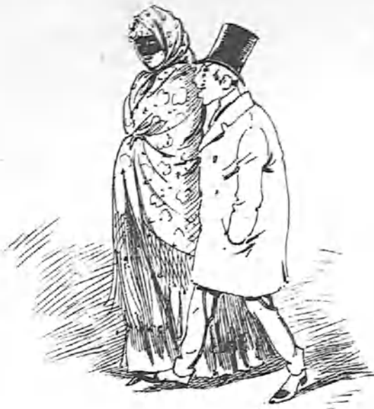
La primera picardia.