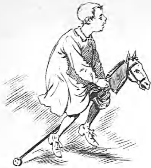
El primer jugueta.