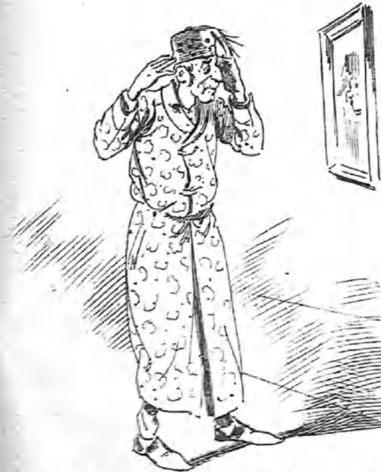
El primer gorro para quedarse definitivamente en casa.