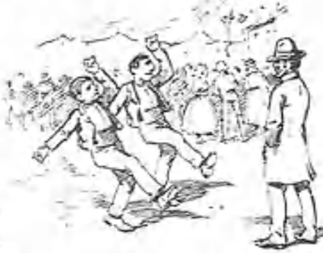
En VILLIMAR.—Este bailecito acaba pidiendo dos reales á cada forastero.