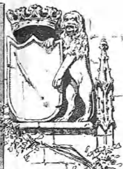
Un escudo de la fachada de la Cartuja.