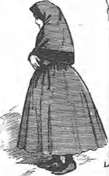
Procedente de la iglesia.