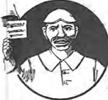
El señor Papamoscas.