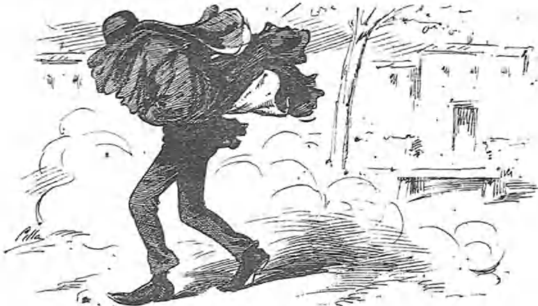
La verdad es que las tardes buenas se deben aprovechar para dar un paseco.