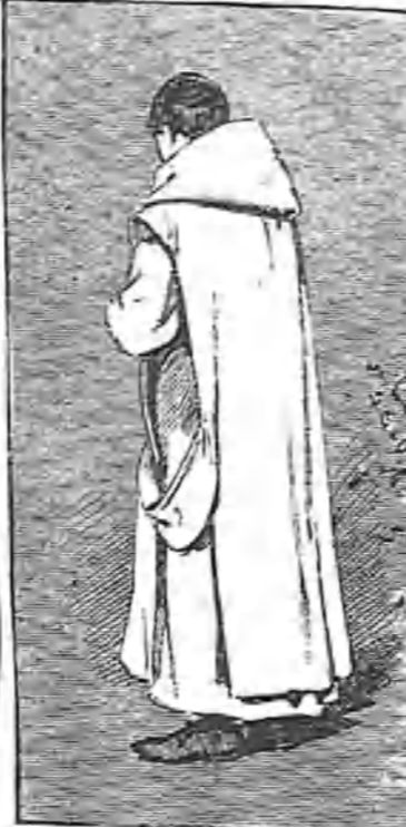
Un fraile de la Cartuja de Miraflores.