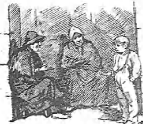
La plaga del país.