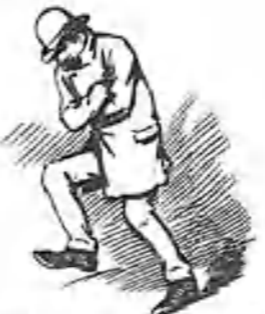
La primera impresión que se siente es de frío.