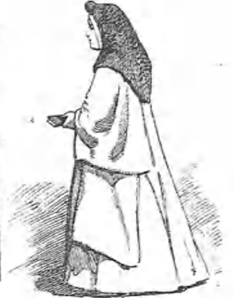
Una monja del Real Monasterio de las Huelgas.