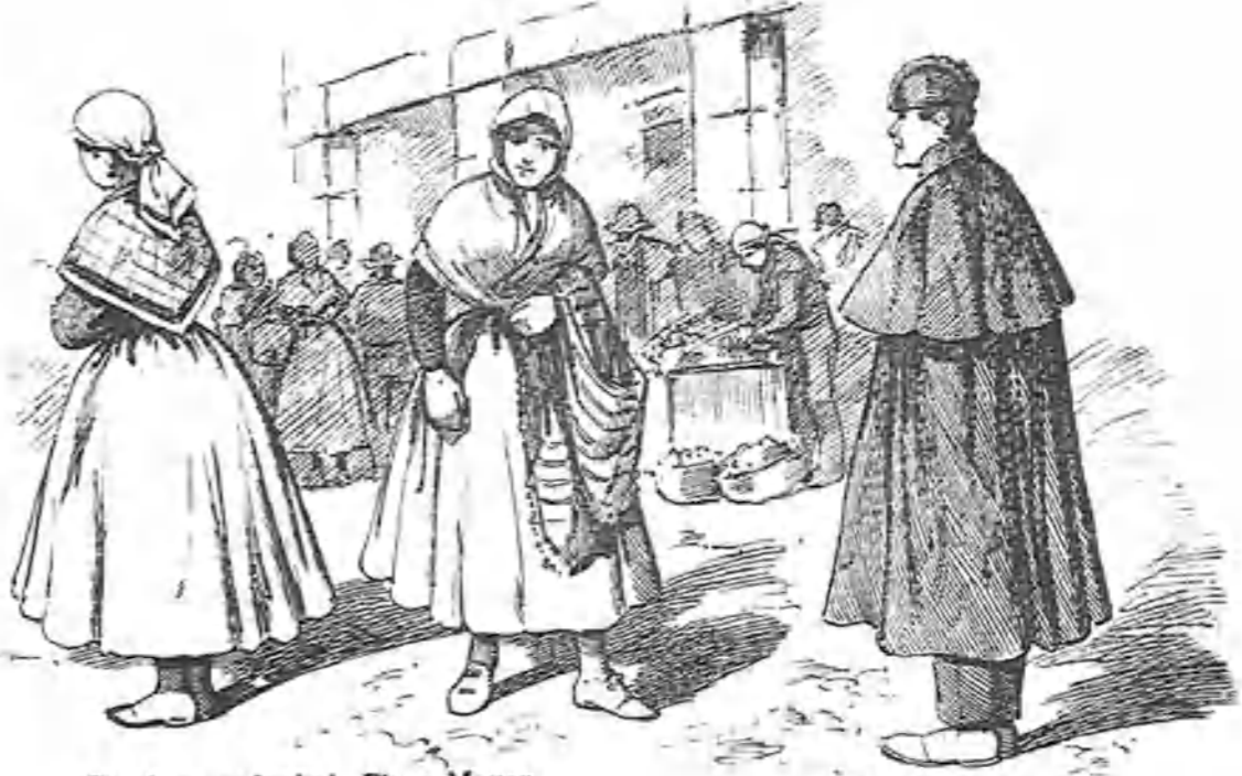
En el mercado de la Plaza Mayor.