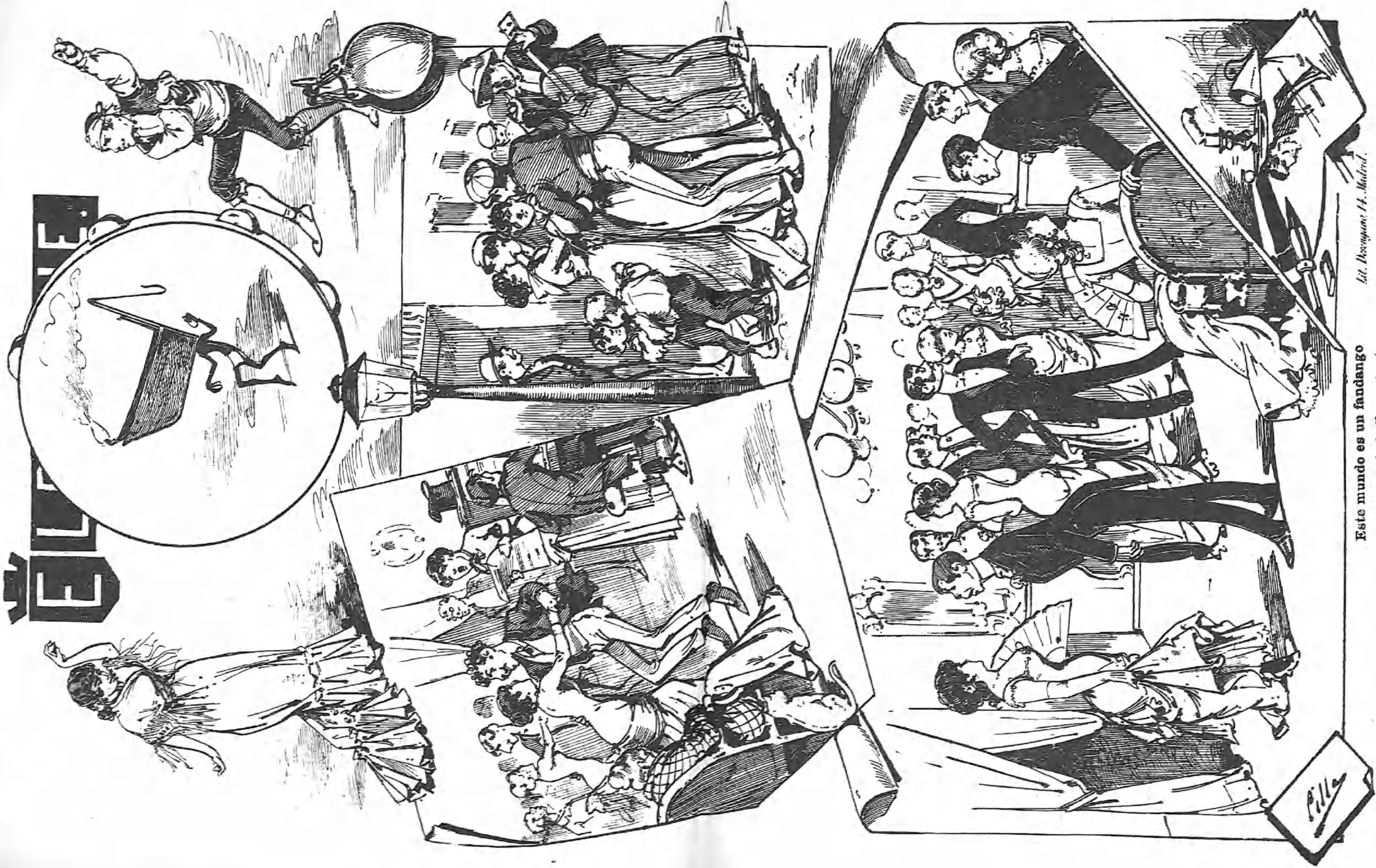
Este mundo es un fandango y el que no lo baila un tonto.