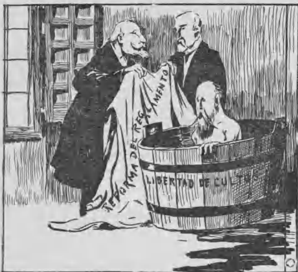
Un baño cortito.

—Escriban ustedes..... «Folleto 1.235..... Prolegómenos de la importación casuística y condicional..... etc..... etc.....»