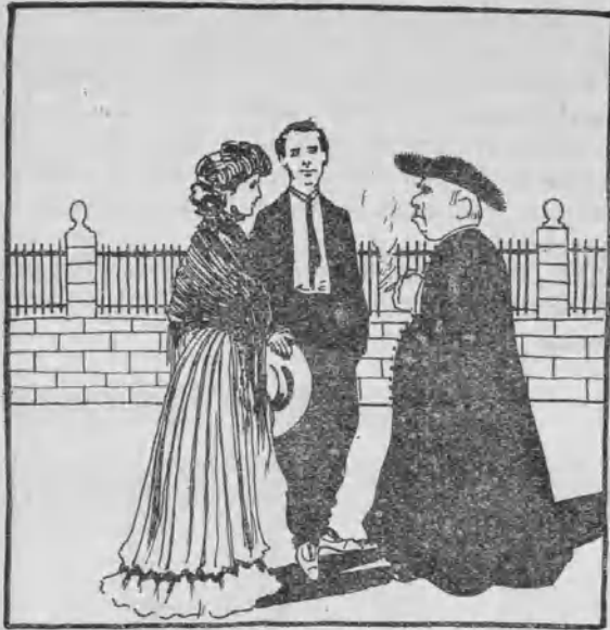
Signo de los tiempos.

—Acabamos de casarnos, señor cura, y venimos a ver qué nos aconseja usted.