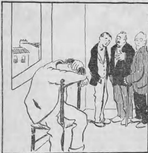
Siguen los trabajos.

—Hombre, no: lo que voy a hacer es darte diez duros para que si ves a mi suegra, la obsequies.