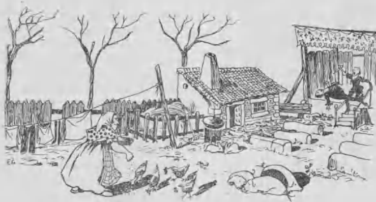
(De un croquis tomado durante el ensayo de El renegado de Villaviciosa .)