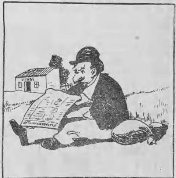
Noticias de sociedad.