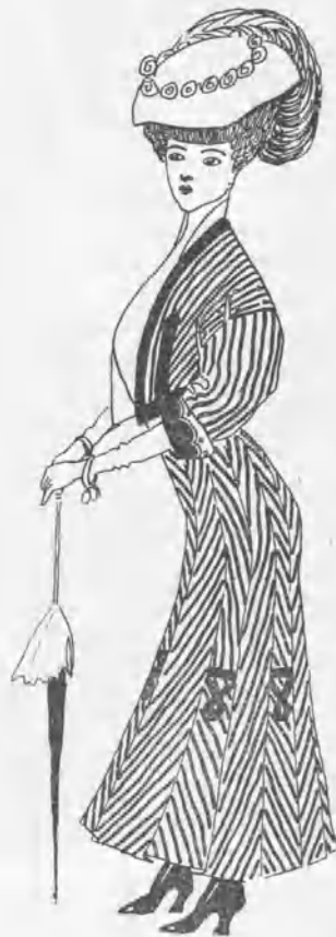
Traje de mañana para calle y paseo

Este traje de mañana, de pasado mañana y de todos los días, es de lanilla listada, con adornos listados y cintas á listas. La moda impone hoy el rayado, lo mismo en las mujeres que en las armas de fuego.