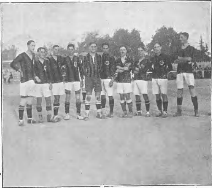
EL PRIMER EQUIPO DEL RACING, QUE TAN BRILLANTEMENTE DEBUTÓ EN LA TARDE DEL DOMINGO

El juego en sí será el que embargue mi atención, no los colores, aquél que mejor sepa desarrollarlo, ese será mi favorito en esta tarde, y el de la afición, y el de la verdad, y el de todos. Y si de esta forma creo enemigos, vengan enhorabuena. Adulador, nunca; justiciero, siempre. Ese es mi lema.