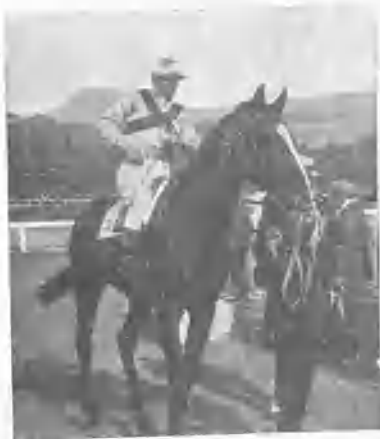
«ANTIVARI», PROPIEDAD DE S. M. EL REY, QUE VENCIO EL DOMINGO EN EL GRAN PREMIO DE OTOÑO EN SAN SEBASTIÁN

de las grandes fiestas romanas, en tiempos del inmortal César. Los carros de triunfo, arrastrados por briosos corceles, cuyas riendas llevaban los patricios más insignes, fueron el prólogo a plazo largo de nuestros actuales hipódromos. Sus premios, por los cuales perdían la vida muchos de los vencidos, eran coronas de laurel, que ceñían a sus frentes, altivas y orgullosas, las vestales, objeto de sus afanes. Como pista tenían las grandes avenidas romanas; como público, el pueblo entero..., y el