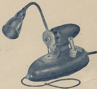
MODELO "SIRI 2000"