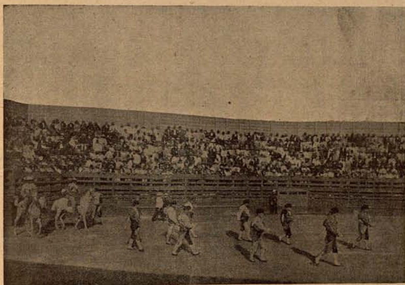
Salida de las cuadrillas.