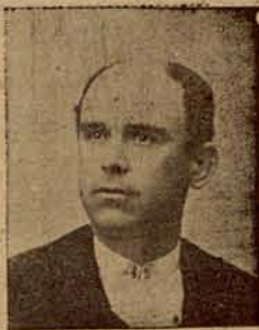
Rafael Guerra (Guerrita). 27 Septiembre 1887 Cauchinos, 10, Córdoba