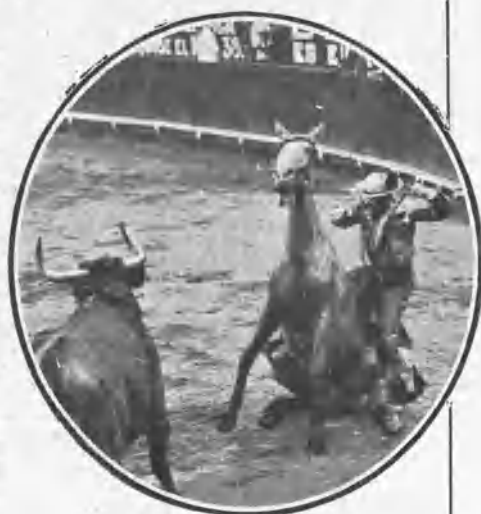
Caida de un picador en el cuarto toro.

Y a en otro lugar publicamos, relativamente extensos, detalles de la corrida que el día 13 del pasado Febrero se celebró en la plaza El Toreo, de Méjico, en la que torearon seis reses de Miura los espadas Cocherito y Gaona.