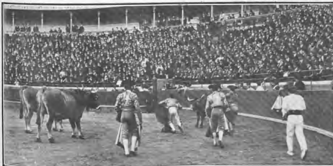
Los cabestros llevando al corral el segundo toro de Fernando Ugarte

También en la plaza de Indauchu hubo elevación de un aeróstato y lidia de dos chotos por Orejito y Mirandito .