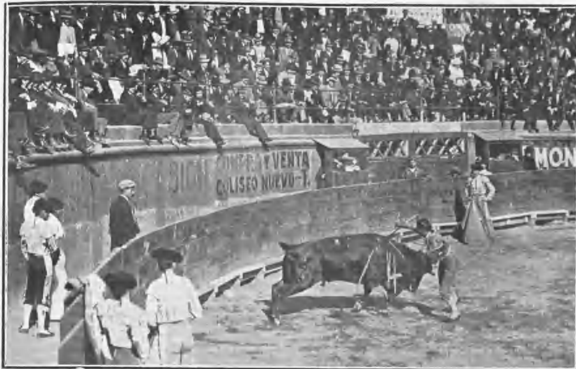
Gaona entrando a matar su primer toro.