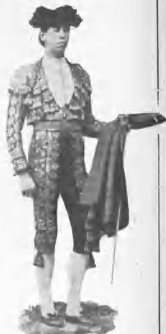
Primer retrato de «Frascuelo» con traje de luces.

“El interés vehemente demostrado por todas las clases sociales desde que se inició la enfermedad de Salvador, y la imponente manifestación de sentimiento producida por su muerte, han patentizado el alto aprecio en que se tenían los grandes mé-