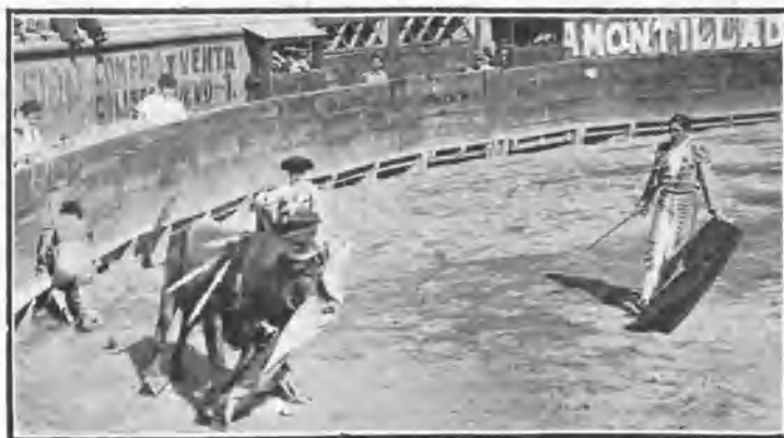
«Cocherito» en su primer toro y percance de Gaona.