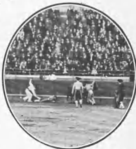
Peligrosa caída del sobresaliente «Barberito».

Feos, bastos, con el pelo del invierno y muy escurridos de carnes, sólo uno, el