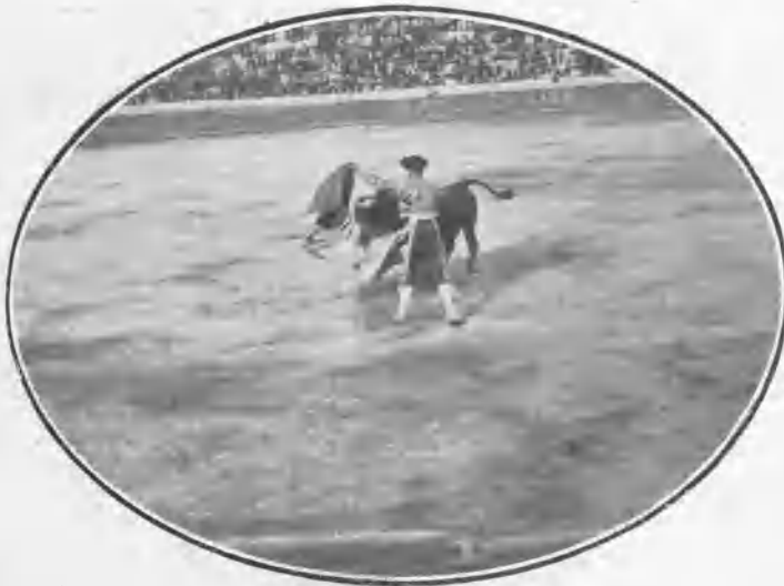
Una verónica de Lombardini.

Con tales elementos no podían mostrar los diestros otra cosa que voluntad.