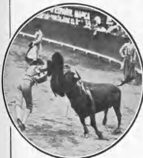
Media estocada de Gaona á su tercer toro.

Sería una lástima, porque á sostener esos grandes entusiasmos han debido acudir las empresas con los mejores diestros y toros bien escogidos y pagados á precios altos.