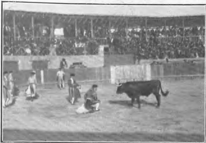
«Alvaradito» rematando un quite.

Los toros cumplieron en el primer tercio