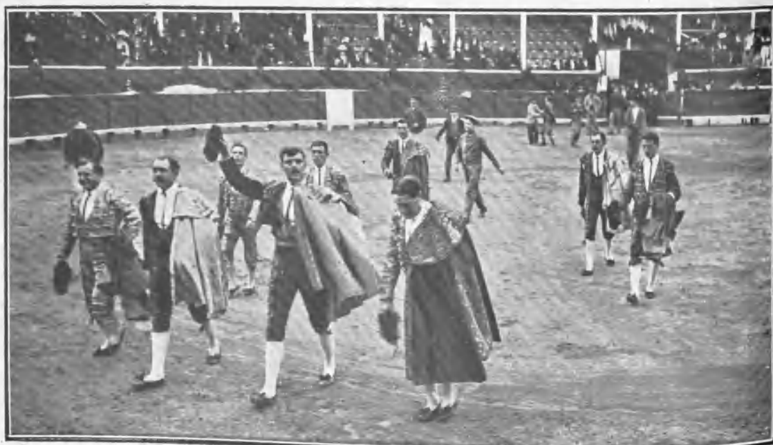
Las cuadrillas recibiendo una ovación al terminar la corrida á beneficio de las inundaciones de París.

Presidió con acierto el alcalde de Argel, y el Club Taurino, que fué el organizador de la fiesta, recibió muchas felicitaciones.