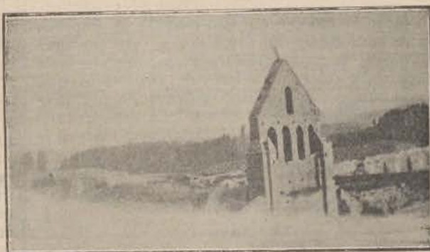
Monasterio Premonstratense de Santa María de Aguilar.

inmediatamente perdieron los números. Con ellos vino el botiquín del pueblo cargado con un médico de urgencia, el cual asistió á muchos ataques que sufrían continuos vecinos de gravedad, entre ellos una jarra de la asesinada que tuvo una fuerte parienta, y gracias á una convulsión de agua que se bebió pudo restablecerse prontamente.