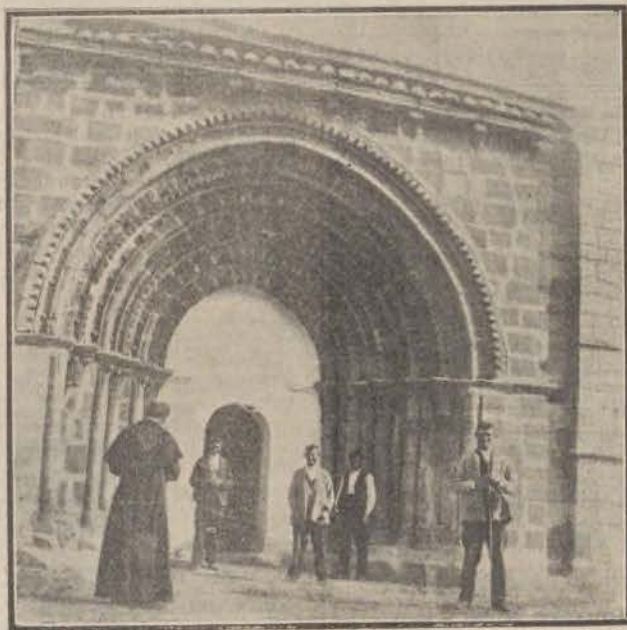
Villanueva de Río Pisuerga.

Y puesto lo dicho acerca del imperdonable asiento de las sepulturas carrionesas, recreáte ahora, lector, con una de las bóvedas del invencible, artísticamente, claustro del monasterio de San Zoilo, en donde, y en un pórtico debajo del coro, están, convertidos en sillares, los sepulcros citados, cegando dos arcos.