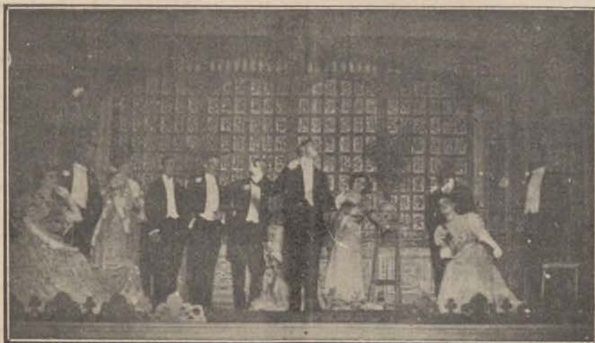
Una escena de «Sábado Blanco».