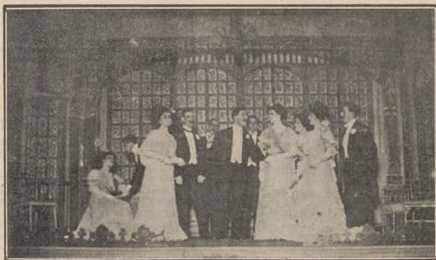
Una escena de «El sábado blanco»