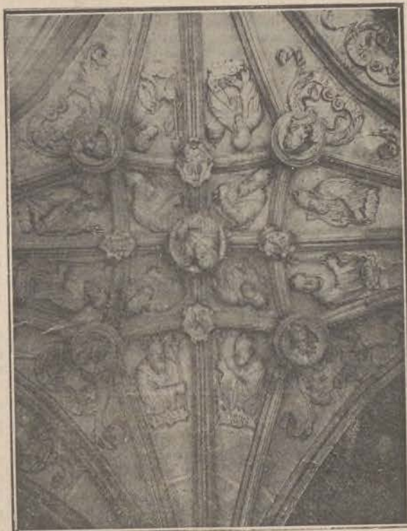
Claustro de San Zoilo.—Carrión.

A poco también llegaron cuatro tricórnios de un cabo á las órdenes de la Guardia civil, los que por llegar