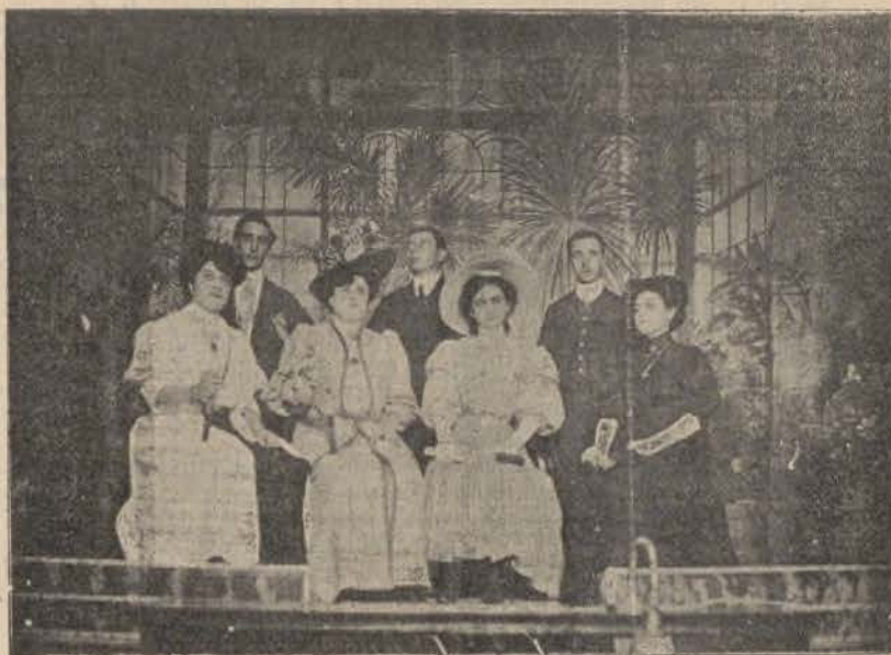
Cuadro de Varietés que actúa en el Salón Madrid

Todo Madrid lo ha podido apreciar en la Zarzuela, en el Lux Eden, en Ideal Polistilo. Hoy, Madrid entero la está aplaudiendo en el pequeño escenario del Salón Madrid.