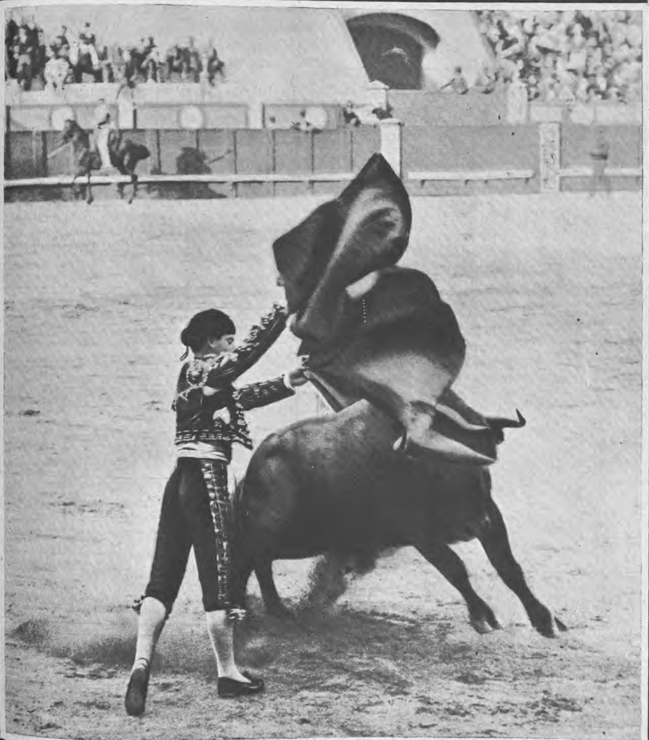
UN BUEN LANCE DE CAPA