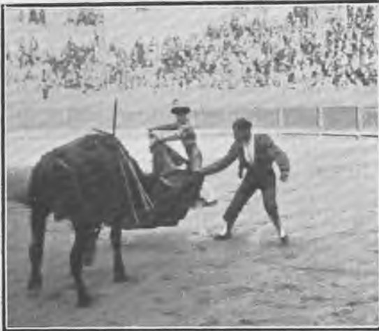
Palma de Mallorca. «Serranito» pasando de muleta á su segundo toro.