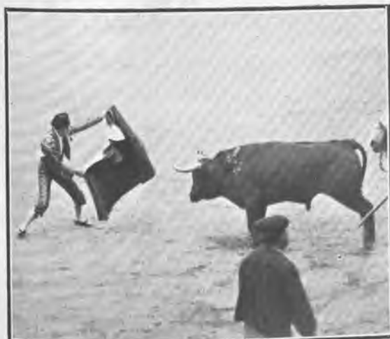
Barcelona. Pacomio en un quite.