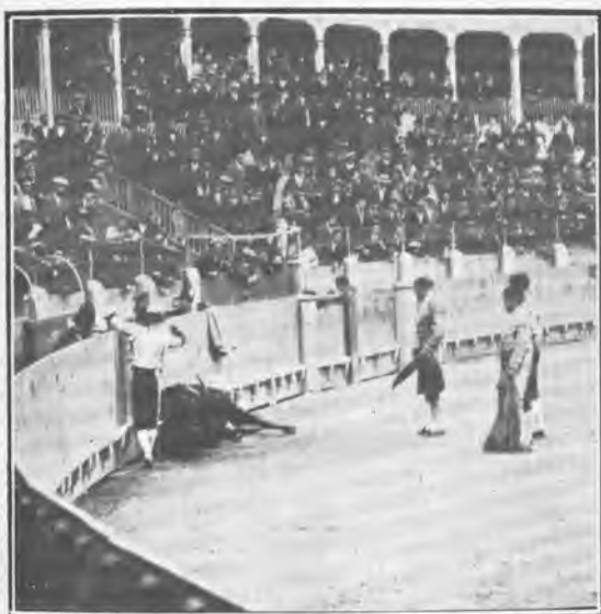
Zaragoza. «Angelillo» después de la estocada á su primero.