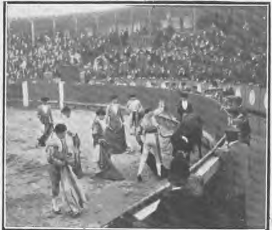
Tetuán. Montes descabellando á su primer toro.