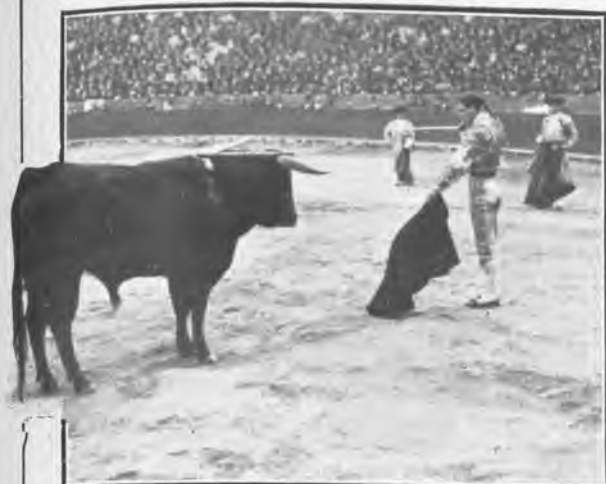
Valencia. «Dominguín» perfilándose para entrar á matar á su primer toro.