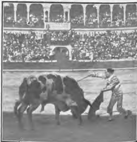
Segunda corrida. «Gallo» entrando á matar.