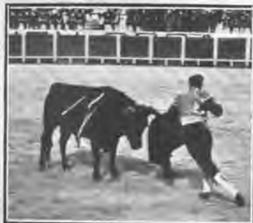
«Bombita» entrando á matar.

En el poco tiempo que han estado allí ambos diestros han