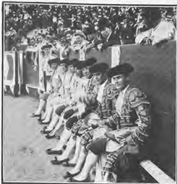
Los hermanos «Bombita» y las cuadrillas.

gran as, ejecutadas con su característica alegría.