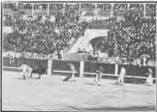
«Regalerín» después de una estocada.

Al cuarto le dió unos buenos capotazos de salida, y al matar no se anduvo con dibujos, tirando