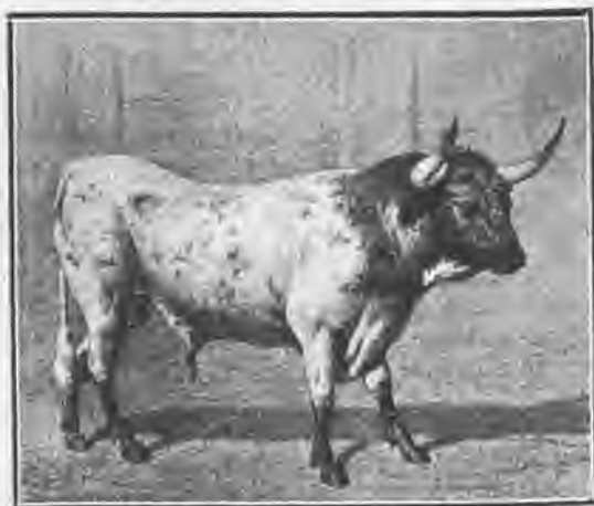
El toro «Jocinero», de Miura, que mató á «Pepete».

Cuando, ya con el amuleto puesto, llegó Ra-