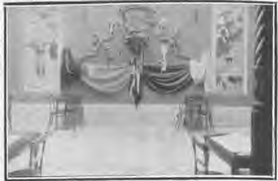
Patio del Círculo .