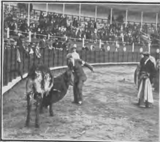
Carabanchel. Becerrrada del Montepío Comercial.