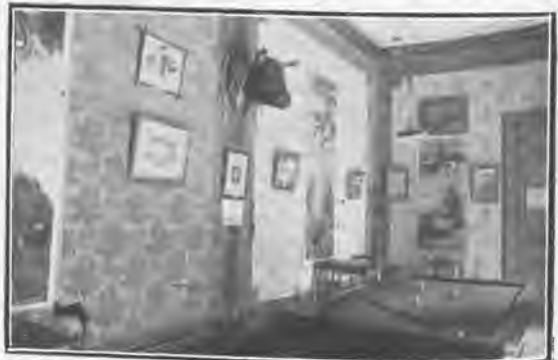
Salón de billar.