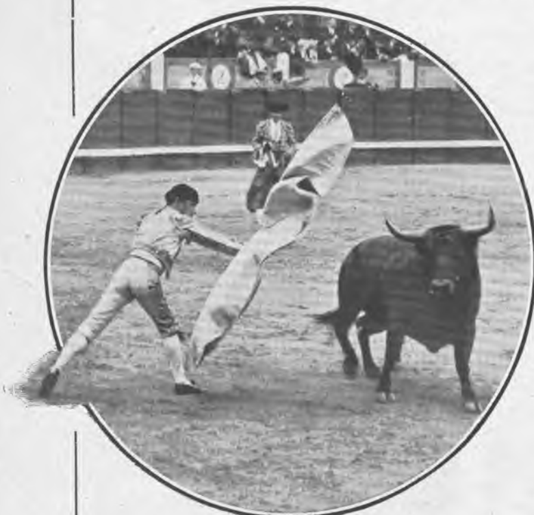
«Regaterín» toreando de capa.

Volvamos á los toros del duque para lamentar el total decaimiento de una vacada