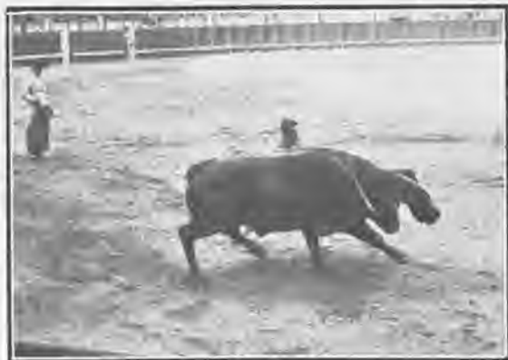
«Pepete» pasando de muleta.

Pablo Baos clavó al primer toro dos monumentales pares de banderillas, y el Vito , en el quinto, dejó otro superior. Agujetas , el venerable anciano, tan valiente y tan buen picador como hace treinta