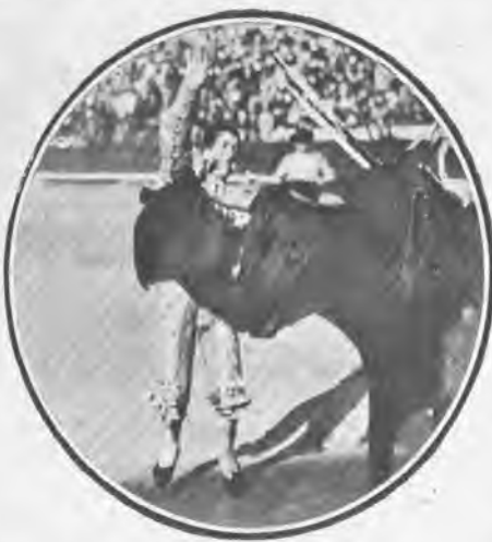
Segunda corrida. «Bienvenida» al salir de matar.

Accediendo á las insistentes peticiones de los sevillanos, contrató la empresa al espada Gallito y éste animó