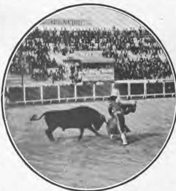
Una verónica de «Bombita» (Ricardo).

En cuanto Ricardo abrió el capote en el primer toro, comenzó á escuchar palmas, y durante toda la fiesta no cesó de oír las en quites, pases de muleta y toda clase de fili-