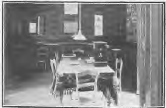
Salón de lectura.