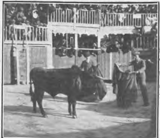
Ventas del Espíritu Santo. Becerrrada de los mudos.