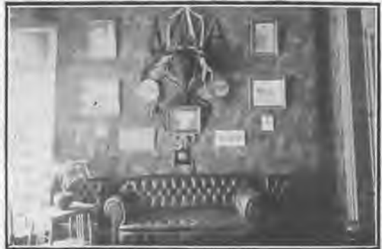
Un salón del Círculo .