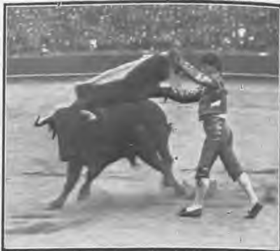
Primera corrida. «Gallo» toreando de capa.

Célebres fueron siempre las corridas de feria en Sevilla, y tal resonancia tenían, que los aficionados de toda España acudían a presenciárlas en la creencia, más bien en la seguridad, de ver algo bueno.