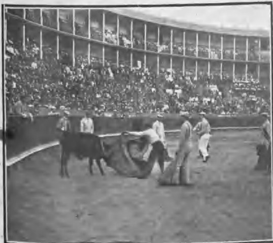
BARCELONA. UN AFICIONADO TOREANDO DE CAPA