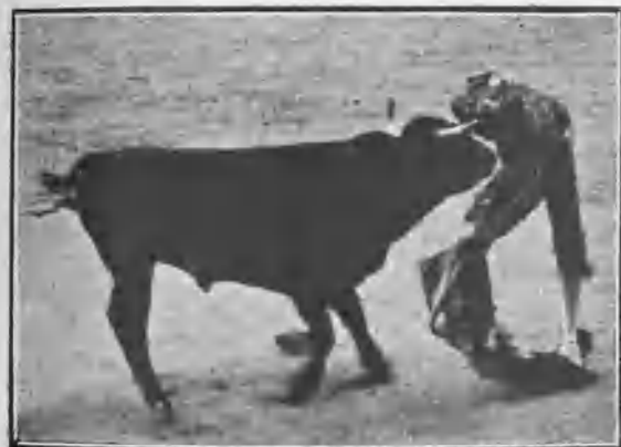
COGIDA DE DOMINGUÍN EN SU SEGUNDO TORO

No se distingue aquella ganadería por su bravura; por lo general, sus toros son cobardes y huidos. Los del domingo hicieron honor á esta fama, y si se exceptúa el corrido en cuarto lugar, que mató cuatro caballos, los demás hicieron lo que se esperaba: mansurronear y sembrar la lidia de dificultades y soserias.