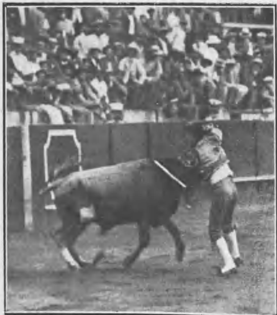
PACO DE ORO ENTRANDO Á MATAR

Hay que reconocer de todos modos que los diestros de la competencia tomaron la cosa muy en serio é hicieron cuanto sabían y algo más para conseguir la medalla de plata que había de otorgar como recompensa al elegido un jurado de aficionados.