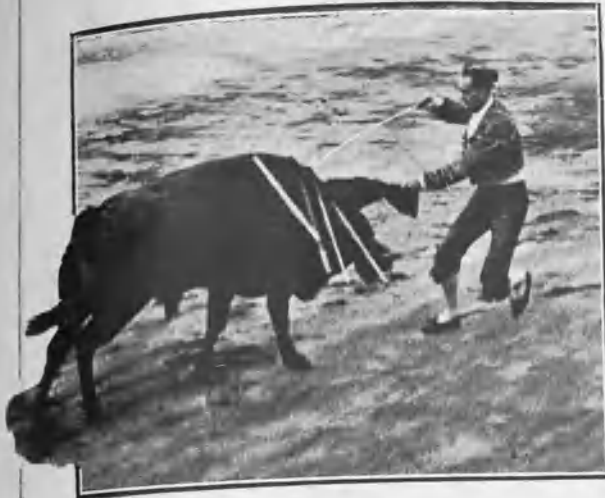
TORTERO MATANDO Á SU PRIMER TORO