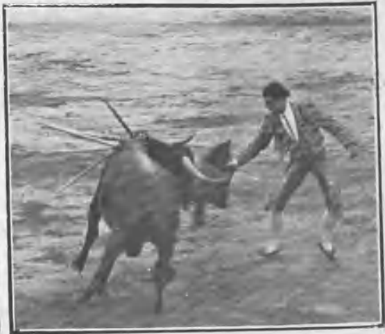
ALGABEÑO II PASANDO DE MULETA