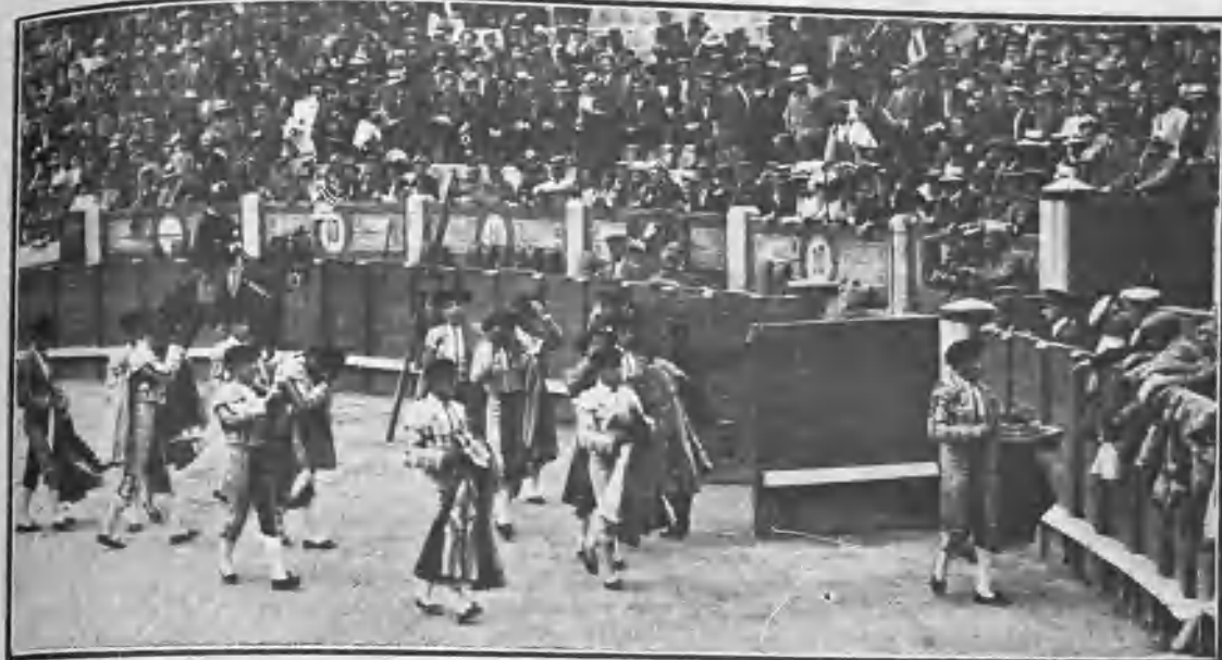
LAS CUADRILLAS CAMBIANDO LOS CAPOTES