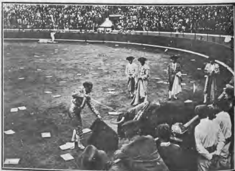
COCHERITO DESCABELLANDO EL SEXTO TORO

Por la mañana murió en los corrales uno de los toros de Muruve, y se le substituyó con uno de Miura, cuyo turno fué sorteado, correspondiéndole matarle á Bombita . No fué una gran cosa.