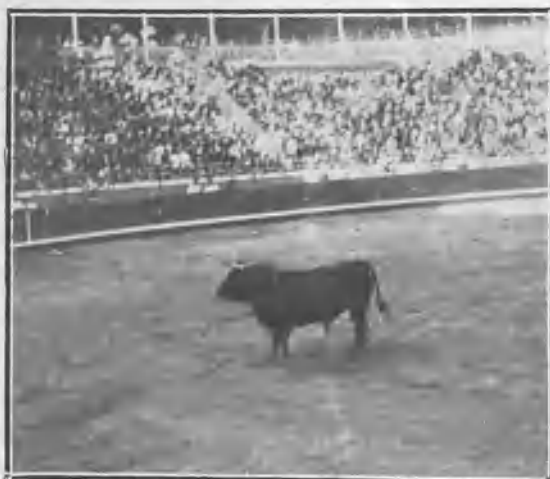
EL TORO PRIMAVERO, QUE AL ARREMETER CON FURIA Á EL LARGO, SE ROMPIÓ LA MANO IZQUIERDA SIENDO PRECISO RETIRARLE Á LOS CORRALES