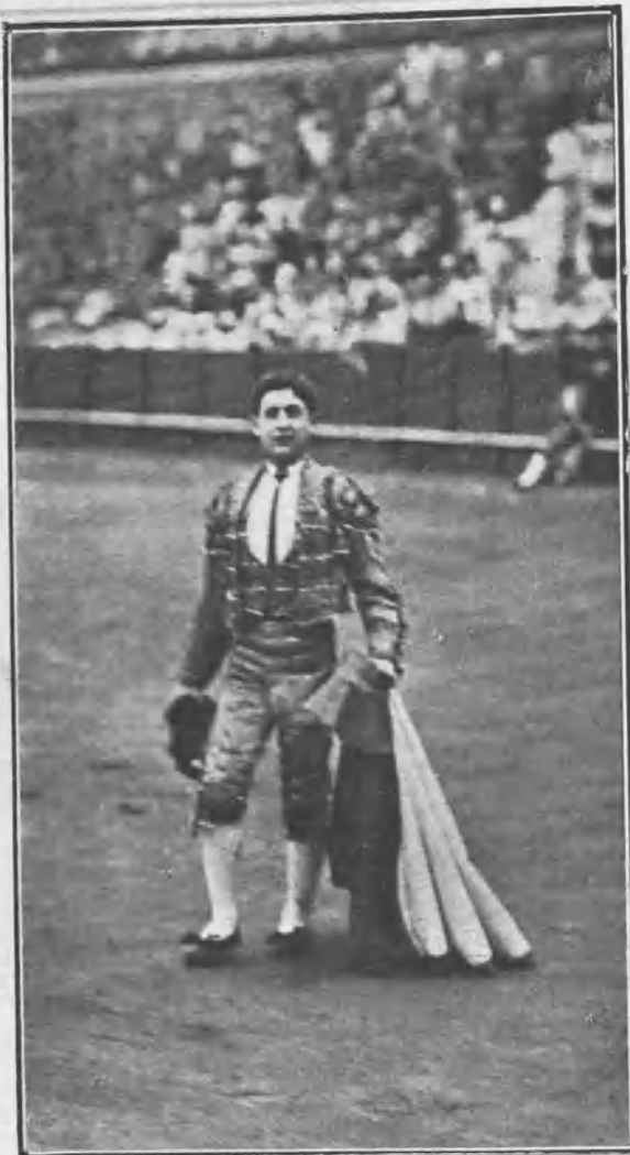
FRASCUELITO SALUDANDO AL PÚBLICO QUE LE APLAUDÍA