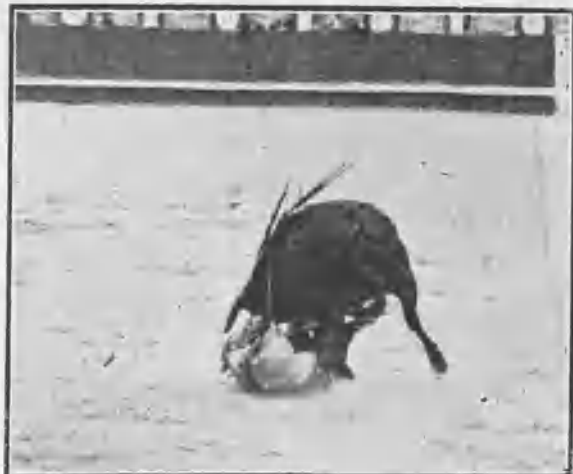
COGIDA DE LOMBARDINI EN SU PRIMER TORO

En quinto lo empuñó por la razón señalada, y aunque la cogida, aparatosa y emocionante, no tuvo las consecuencias funestas que en un principio se creyó, pudo ser muy grave, en razón á