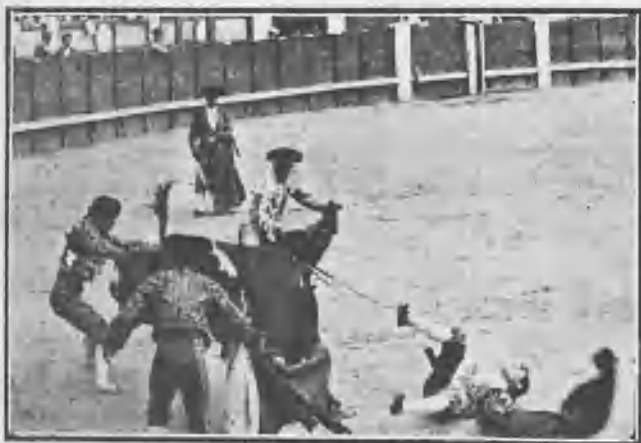
COCIDA DE CONEJITO III