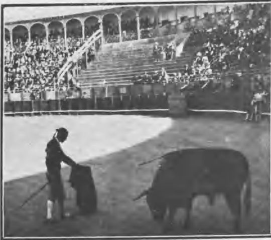
TOLEDO. DOMINGUÍN EN SU PRIMER TORO