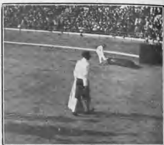
COCHERITO VISTIENDO LA BLUSA BLANCA DE UN MONO SABIO RECIBIENDO UNA OVACIÓN POR LA MUERTE DEL SEGUNDO TORO