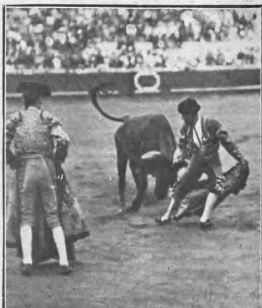
RECOVERO TOREANDO DE CAPA