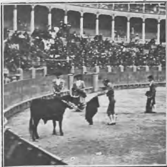
PERLITA TIRÁNDOSE Á MATAR EN SU PRIMER TORO