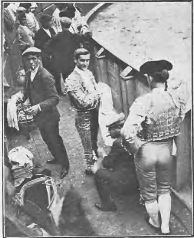
BOMBITA ENTRE BARRERAS MIENTRAS LE COSIAN LA TALEGUILLA