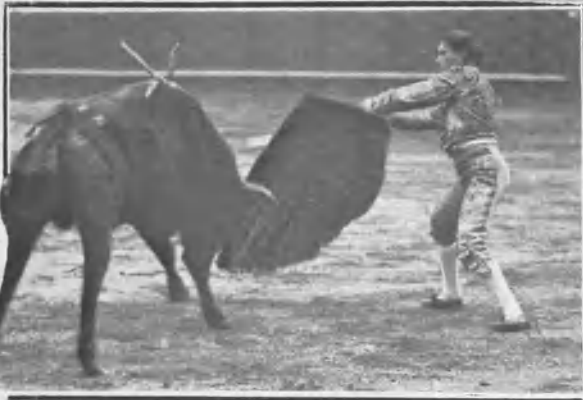
VÁZQUEZ PASANDO DE MULETA