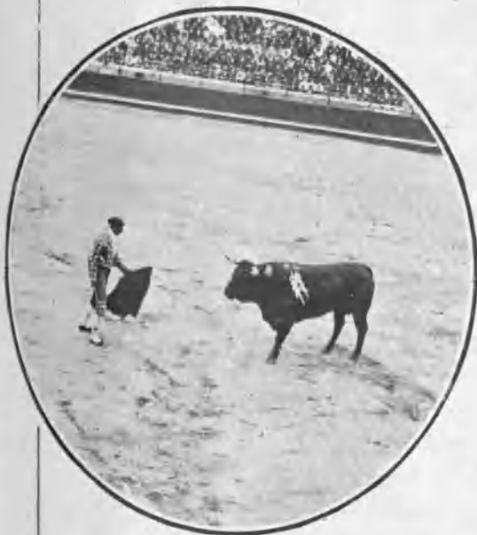
BOMBITA PASANDO DE MULETA

mentables que la rotura de la taleguilla. Por fortuna, en la corrida siguiente se desquitaron ambos diestros con creces.