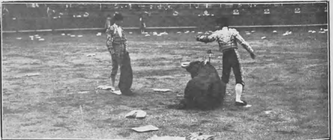
DANDO LA PUNTILLA AL SEXTO TORO, DURANTE CUYA LIDIA SE PROMOVIÓ UN GRAN ESCÁNDALO