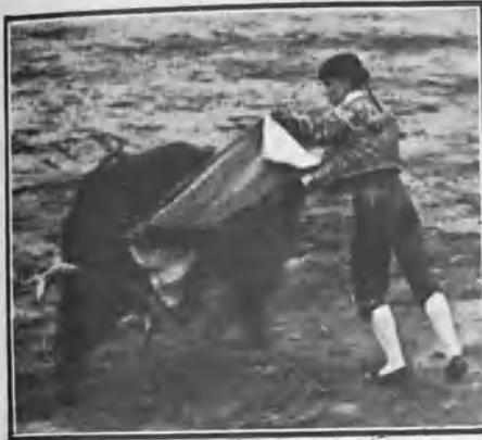
CANELA LANCEANDO DE CAPA