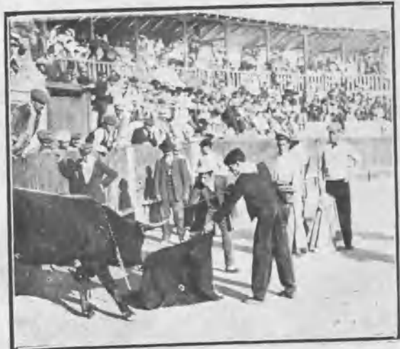
TETUÁN. DESCABELLANDO UN BECERRO