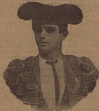
Rafael Gonzalez (Machaquito)