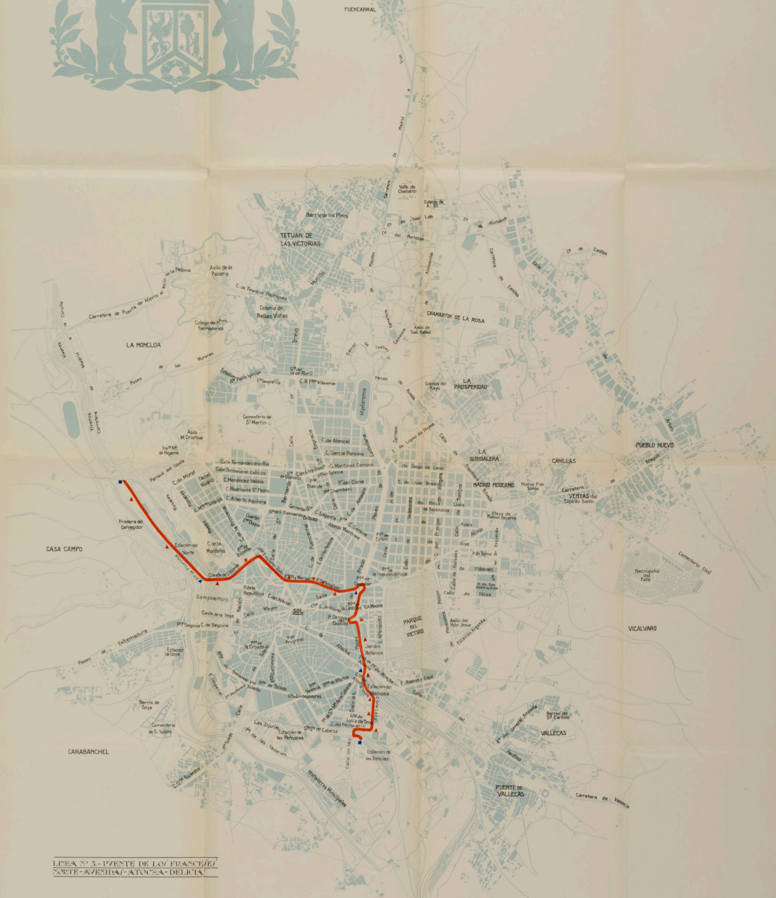
LÍNEA N.º 5.- PUENTE DE LCV/ FRANCÉS/E/ NORTE-AVENIDA/ -ATOCHA- DELICIA.